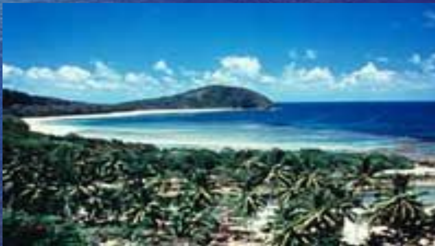
Чудеса природы Австралии. Черниенко И.А.