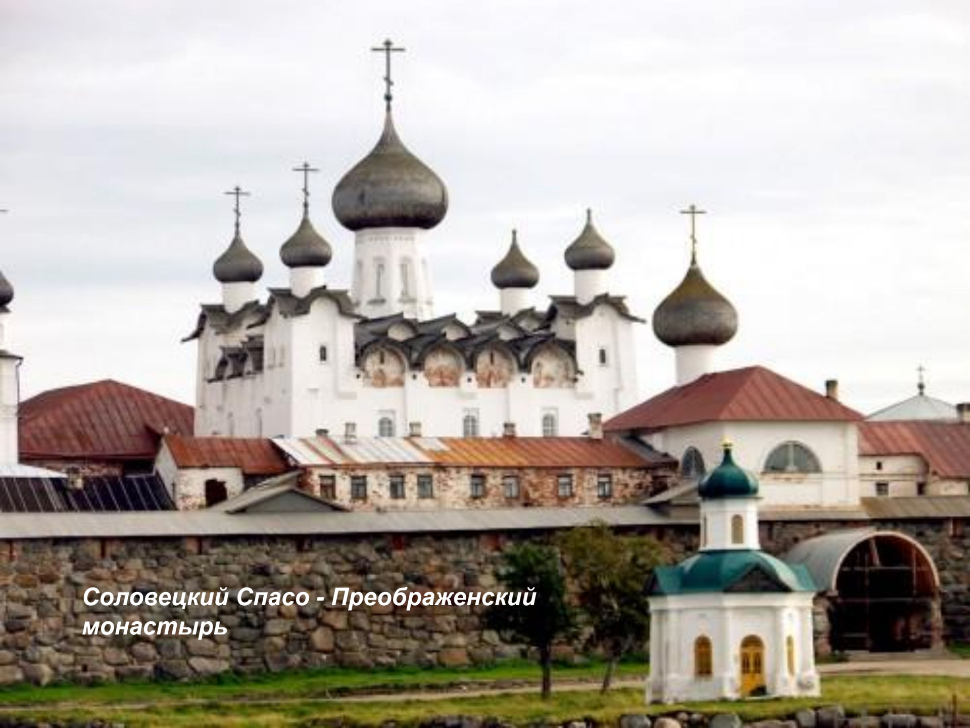
Соловецкий Спасо - Преображенский монастырь