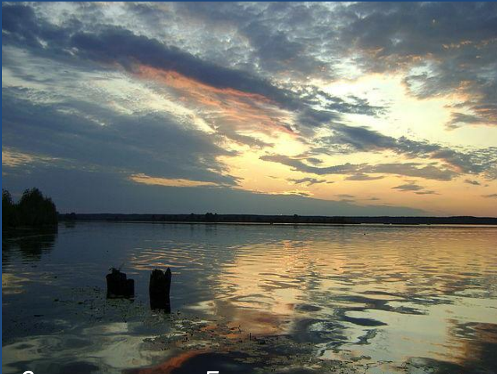
Закат на озере Большое

Озёр в Воротынском левобережье немало. Большая часть из них имеет песчаное дно, а лишённые растительности участки песчаных же берегов являют собой самой природой созданные пляжи.