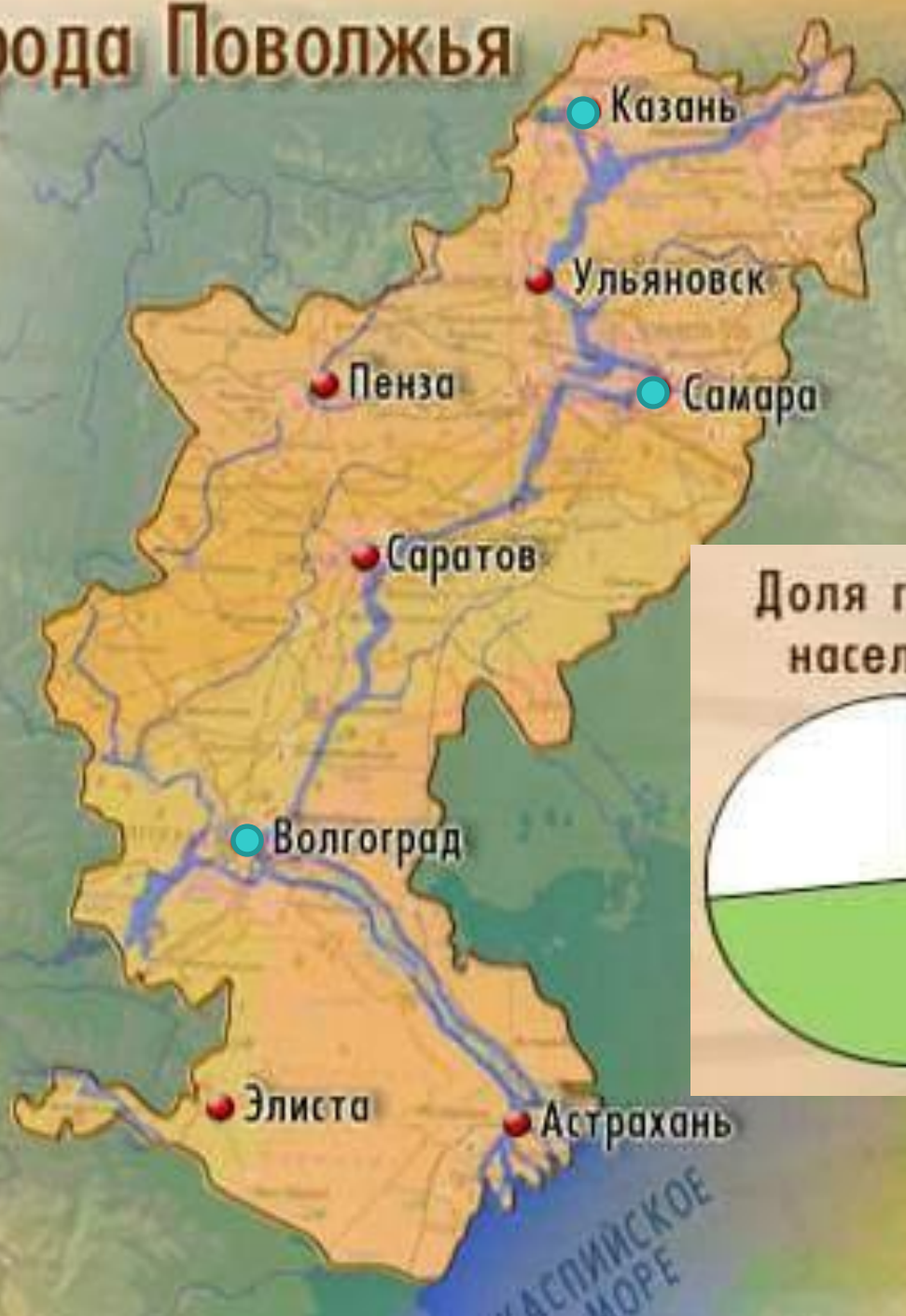
Доля городского населения, %