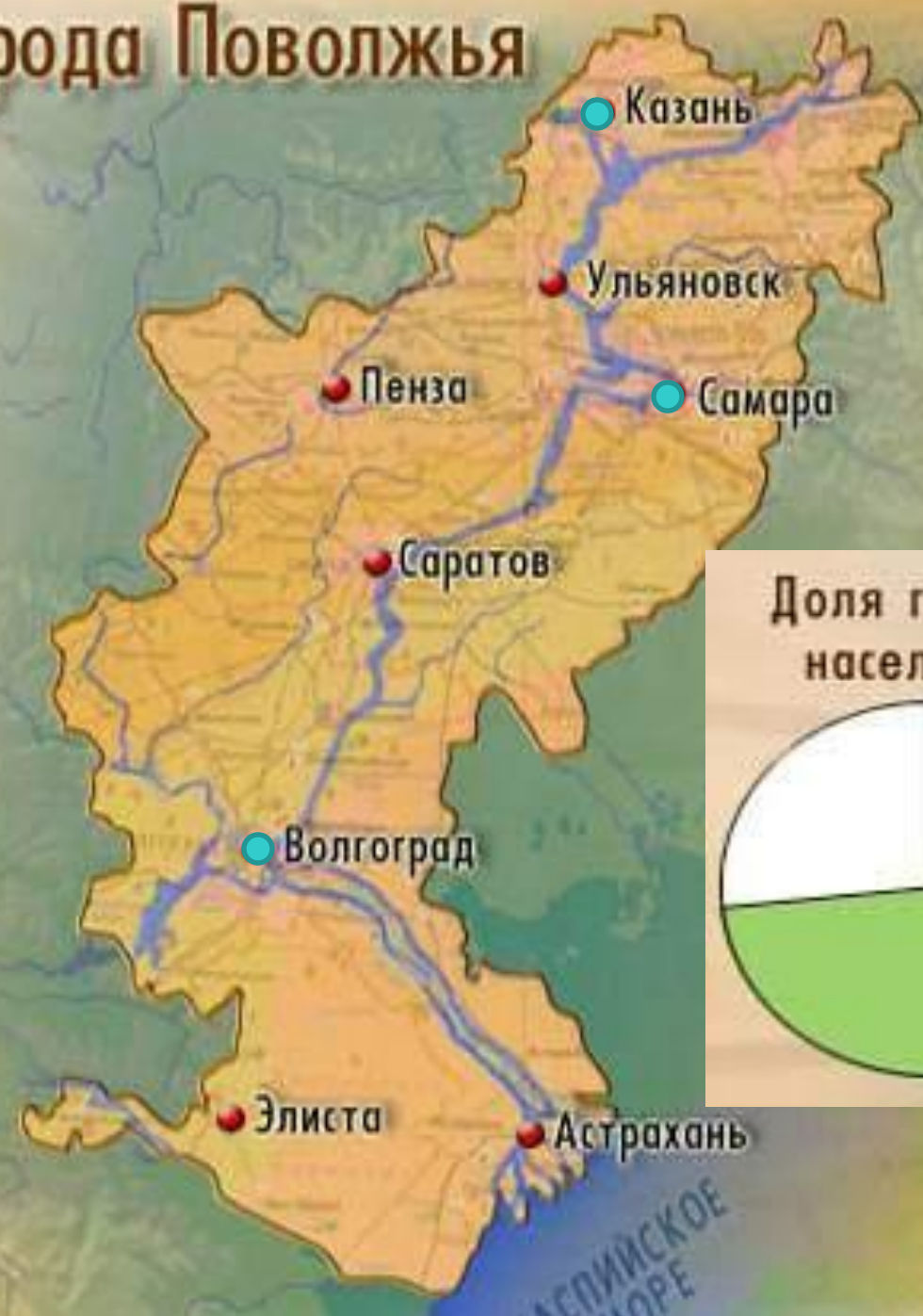
Доля городского населения, %