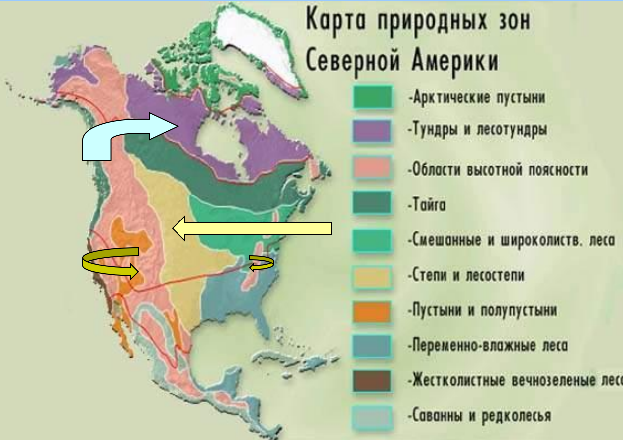
Карта природных зон Северной Америки