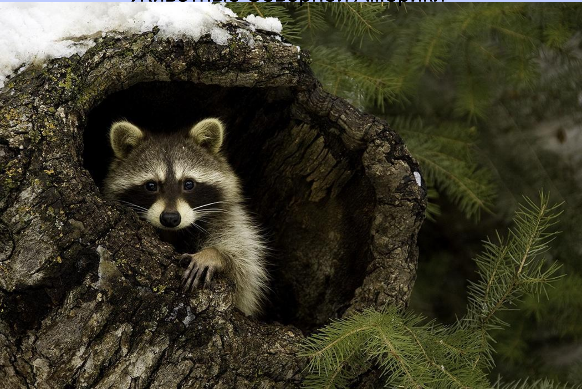
ЕНОТ – ПОЛОСКУН