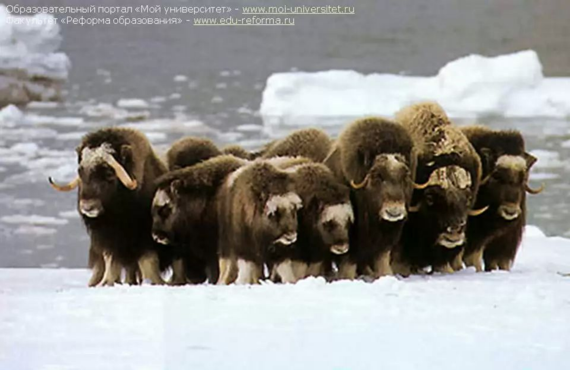
Овцебык – самое выносливое животное, не боится холода и мороза. Его толстая шкура защищает его от ветров и морозов, а мощные рога опасны для его врагов – волков.