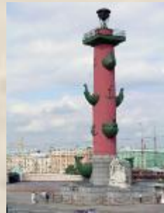
Скульптуры Ростральных колонн