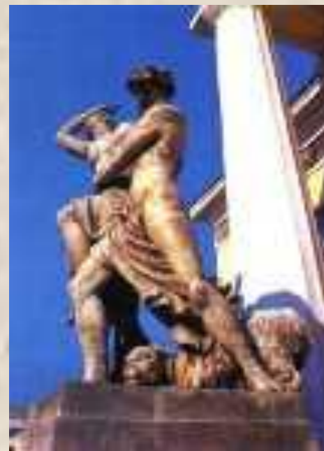
Скульптуры у Горного института