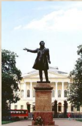
Постамент памятника Пушкину