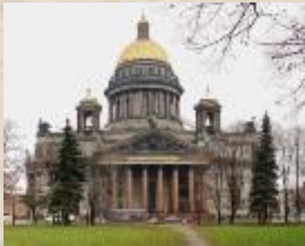
Колонны Исаакиевского собора. Арх. Монферран. Масса колонн – 114 т. Высота собора – 101 м