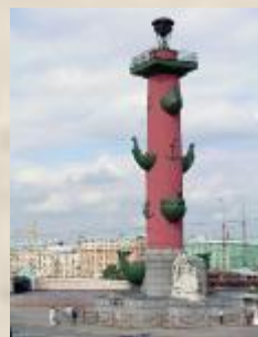
Скульптуры Ростральных колонн