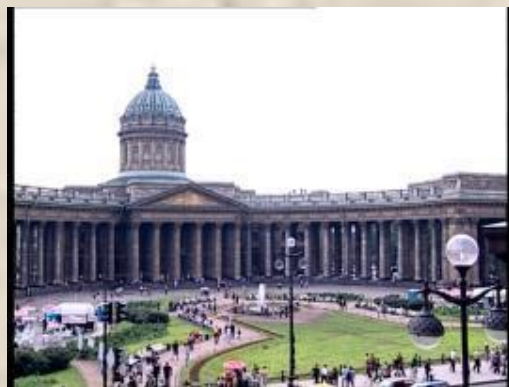
Казанский собор (Воронихин)