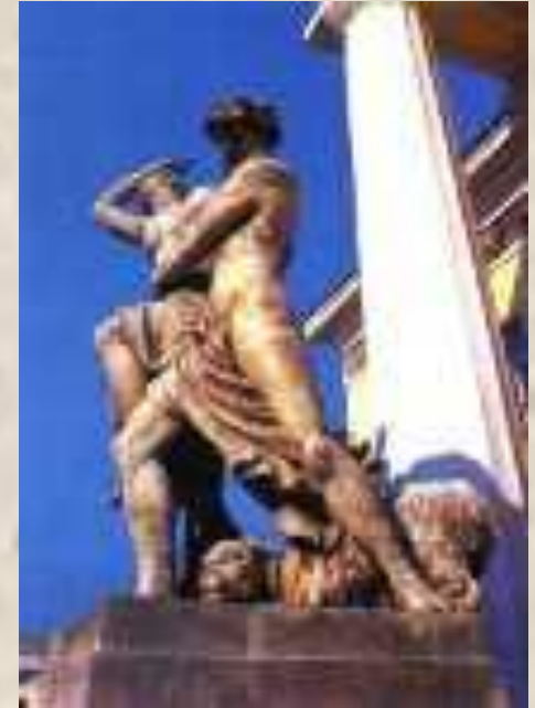
Скульптуры у Горного института