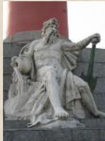
Скульптуры Ростральных колонн