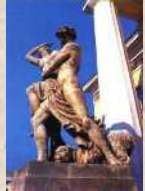
Скульптуры у Горного института