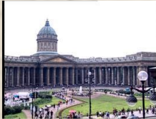
Казанский собор (Воронихин)