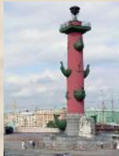
Скульптуры Ростральных колонн