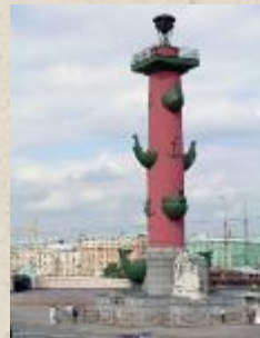
Скульптуры Ростральных колонн