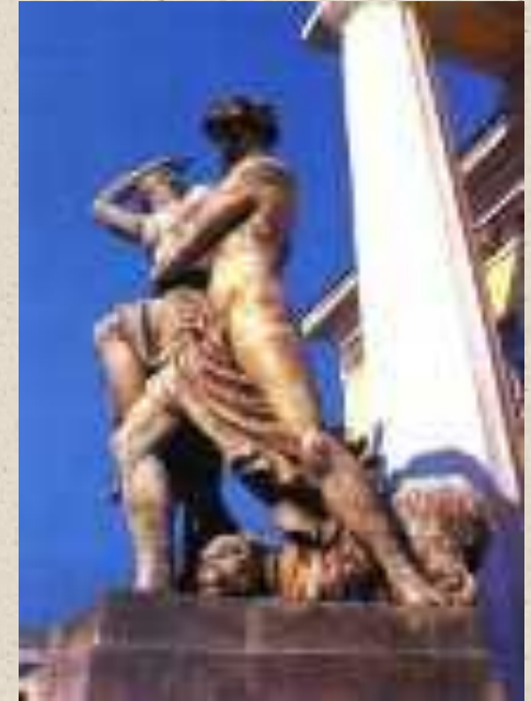
Скульптуры у Горного института