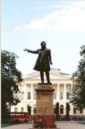
Постамент памятника Пушкину