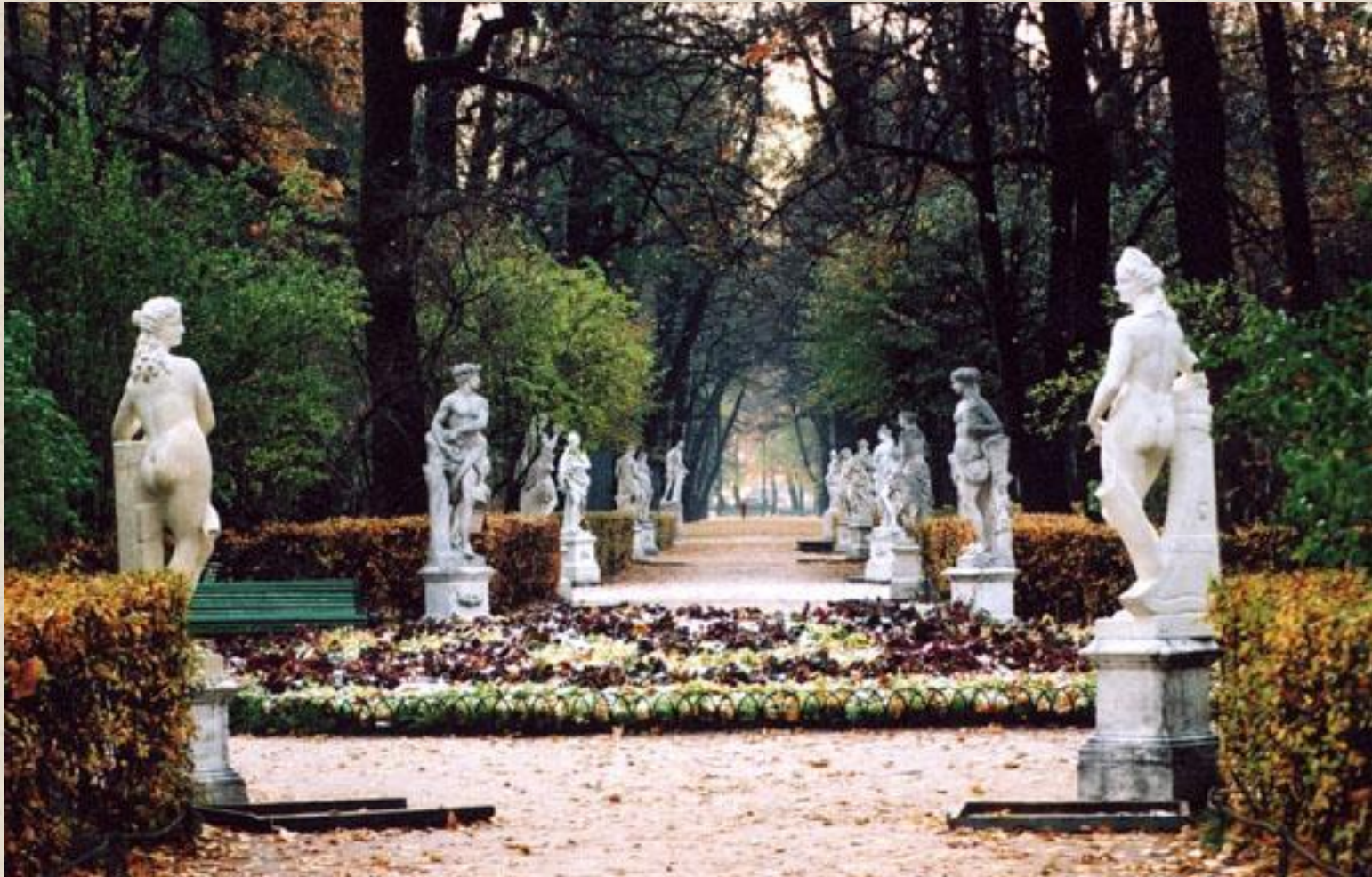
Скульптуры Летнего сада

Белый, равнозернистый, полупрозрачный. Италия