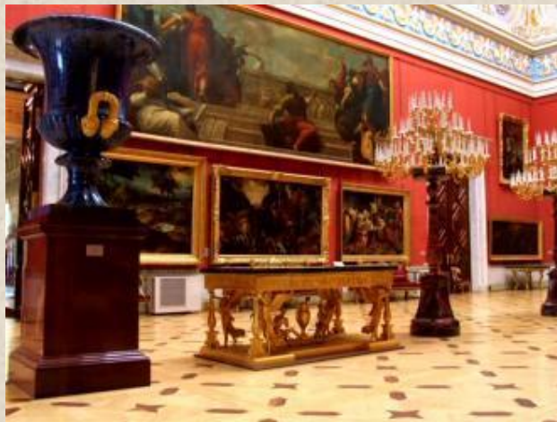
Чаша из лазурита.