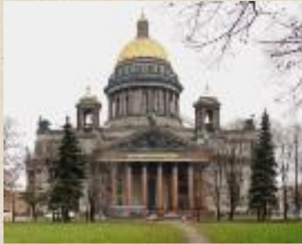
Колонны Исаакиевского собора. Арх. Монферран. Масса колонн – 114 т. Высота собора – 101 м