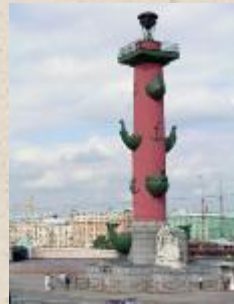
Скульптуры Ростральных колонн