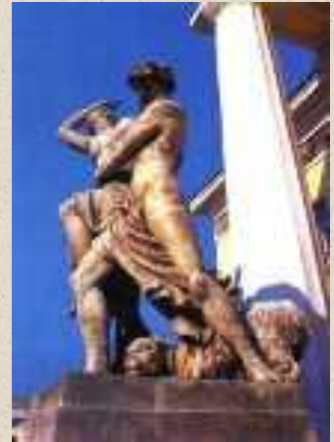
Скульптуры у Горного института