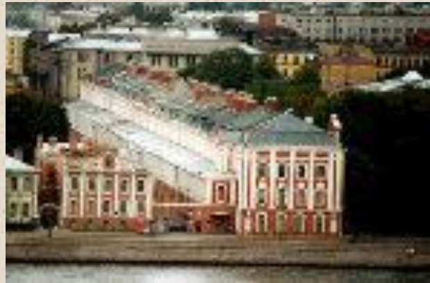
Здание 12 коллегий