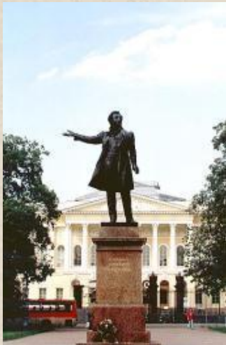
Постамент памятника Пушкину