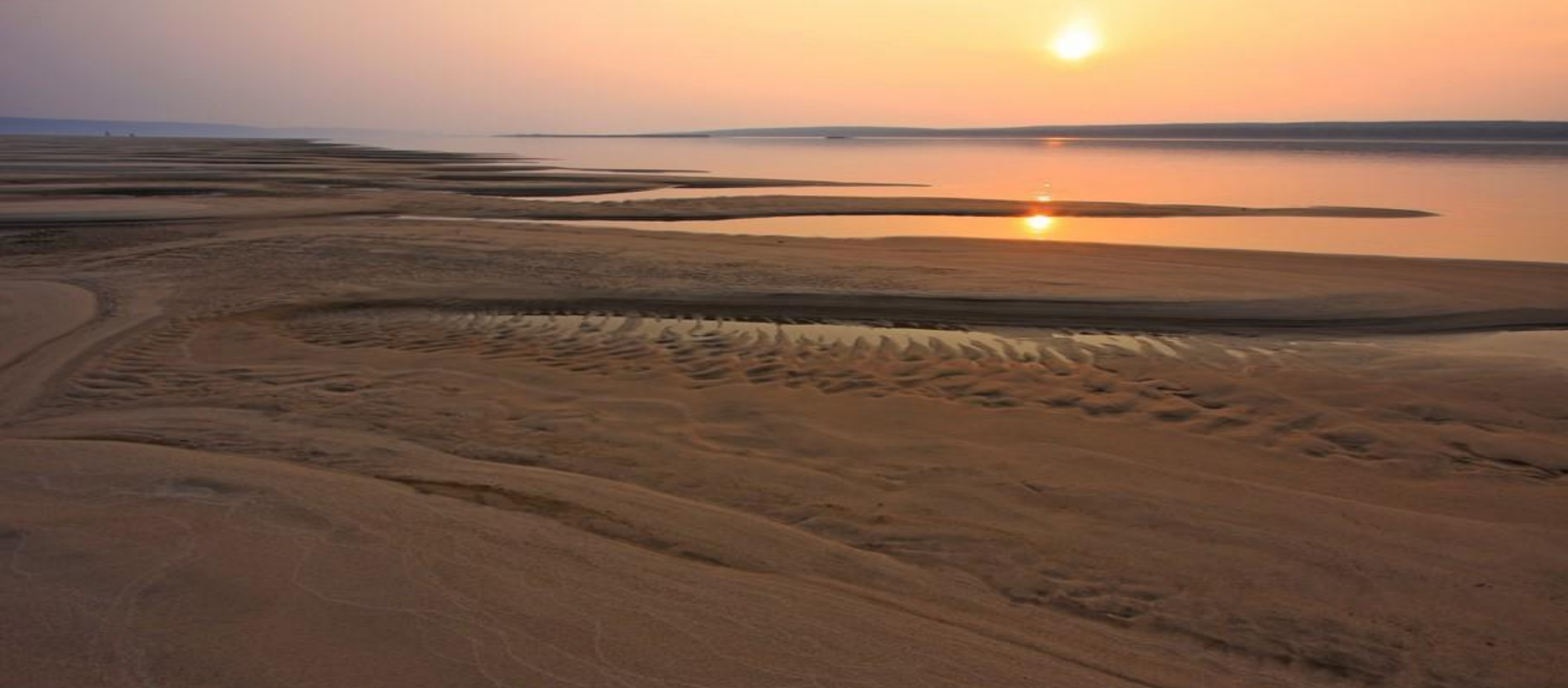
Закат возле парка “Ленские столбы”

Основу животного мира парка составляют представители сибирской фауны в сочетании с южно-таежными и арктическими видами. В парке произрастает 21 вид редких и исчезающих «Краснокнижных» растений. Фауна рыб насчитывает 31 вид. Гнездится на территории 101 вид птиц. В целом фауна здесь типична для среднетаежной подзоны Палеарктики с распространением таких животных, как соболь, бурый медведь, белка, лось, бурундук и т.д. К обитателям горно-таежного комплекса относятся кабарга, северная пищуха, Горно-лесная форма дикого северного оленя. Ряд видов — изюбрь, пашенная полевка, некоторые представители рукокрылых и насекомоядных, характерны для южно-таежной