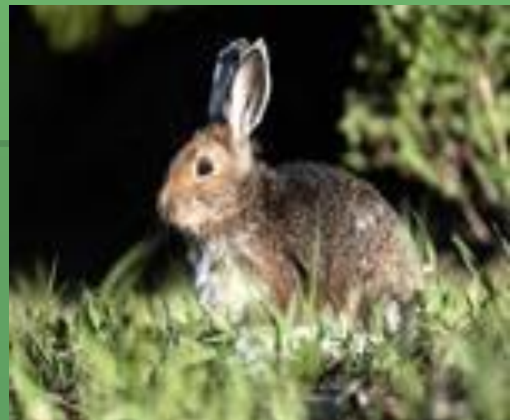
Заяц - русак