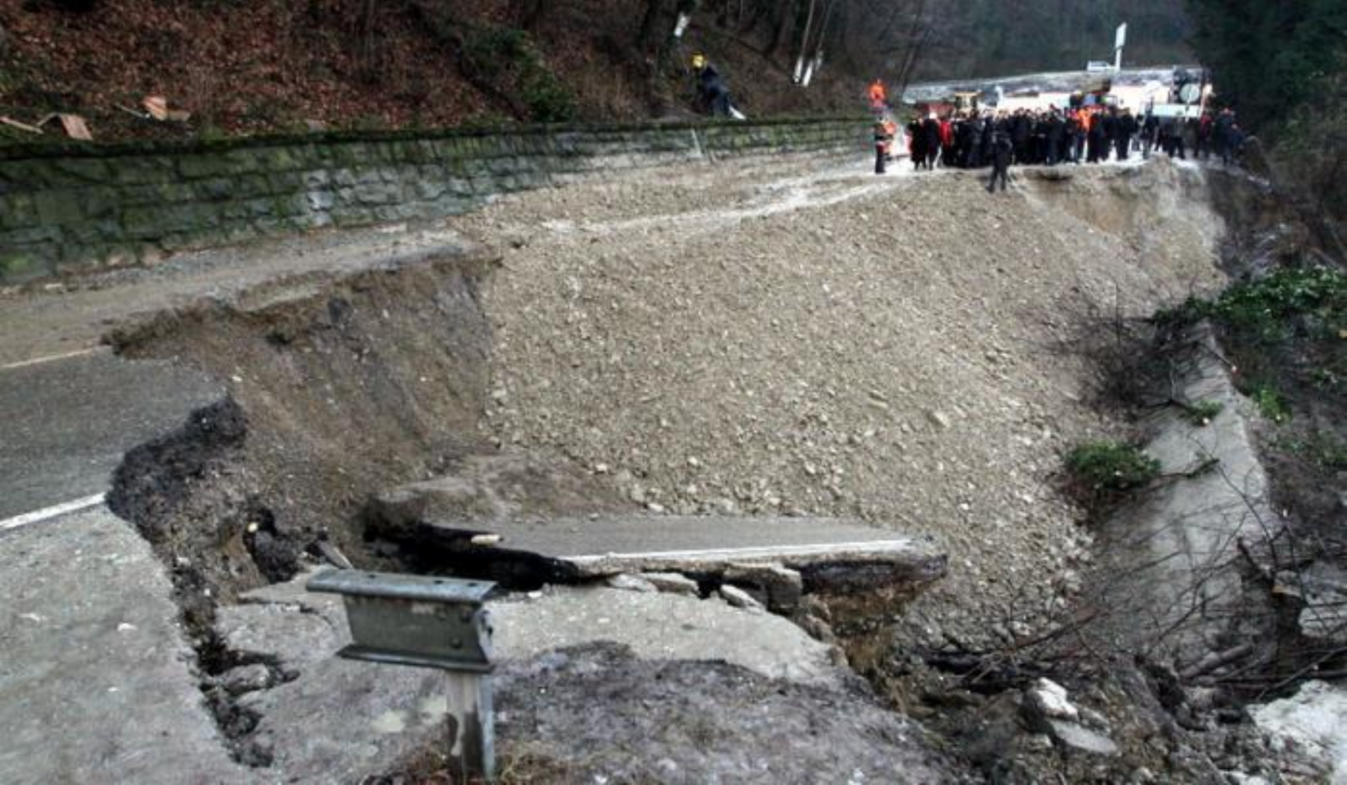
Оползень под Туапсе 2011