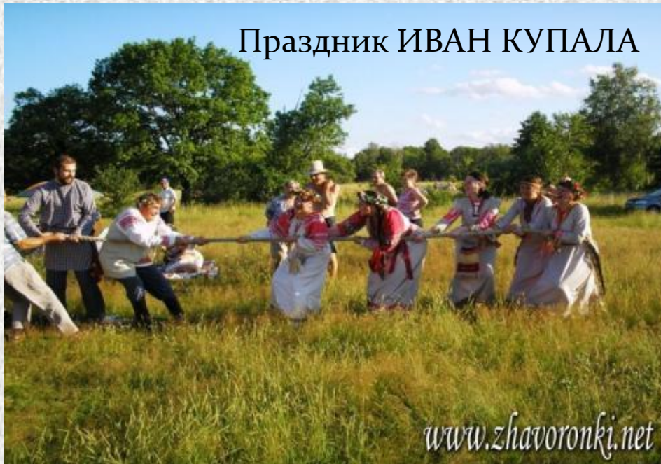
Праздник ИВАН КУПАЛА

Во Владимире проходят разнообразные тематические фестивали и ярмарки, которые составляют перспективную структуру туризма. Мы считаем, что было бы неплохо, если в Кунгуре активнее развивался этот вид туризма.