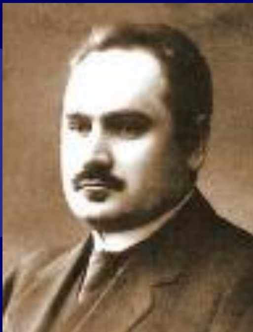
Хейкки Й. Хеллман – основатель концерна HELKAMA