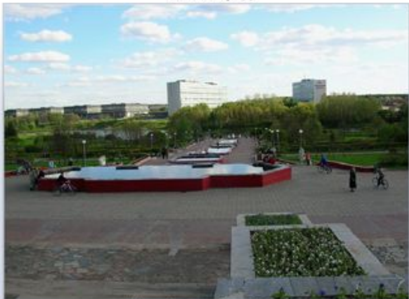
Каскад фонтанов в Парке Победы.

Точное машиностроение производит продукцию в основном «двойного» (и гражданского, и военного) назначения. Главный центр российской электронной промышленности - Зеленоград (входит в состав Москвы). Важные центры приборостроения и электротехники - Москва, Рязань, Владимир, Ярославль, Рыбинск. В Москве и Угличе выпускают часы.