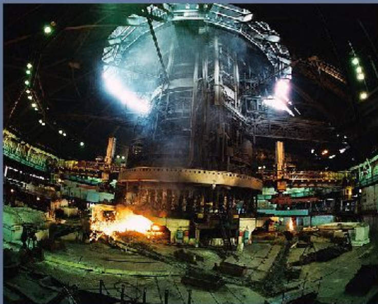
Новолипецкий металлургический комбинат.

Металлургический комплекс, производящий более 1/3 промышленной продукции района, является лидером в хозяйстве. Крупнейшие карьеры по добыче относительно бедной руды открытым способом находятся у Старого Оскола (Белгородская обл.) и Железногорска (Курская обл.). В шахтах руда добывается на Яковлевском месторождении. Крупный Новолипецкий металлургический комбинат полного цикла, производящий более 7 млн т стали в год, действует в Липецке. В Старом Осколе находится электрометаллургический комбинат, производящий сталь непосредственно из железной руды, минуя стадию получения чугуна . Это наиболее современное предприятие чёрной металлургии в России, выпускающее сталь и прокат самого высокого качества.