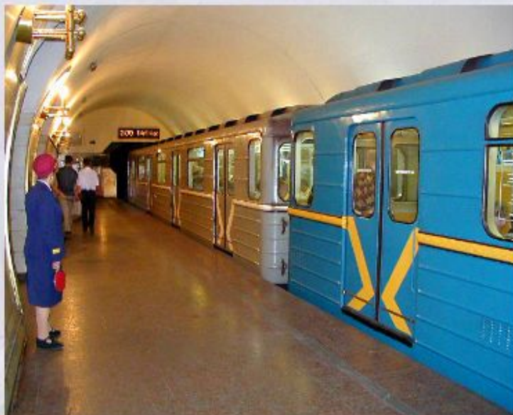
Вагоны метро - продукция Мытищинского машиностроительного завода.

Машиностроительный комплекс района не имеет себе равных в России по численности занятых и объёму производства. Главным центром автомобилестроения является Москва; в Московской обл. находится сразу три автобусных завода. В Ярославле и г. Ярцево (Смоленской обл.) построены моторные заводы, в Коврове выпускают мотоциклы, а в Туле - мотороллеры. Магистральные тепловозы производят в Коломне, маневровые тепловозы и дрезины - в Муроме, Брянске, Калуге, Людиново.