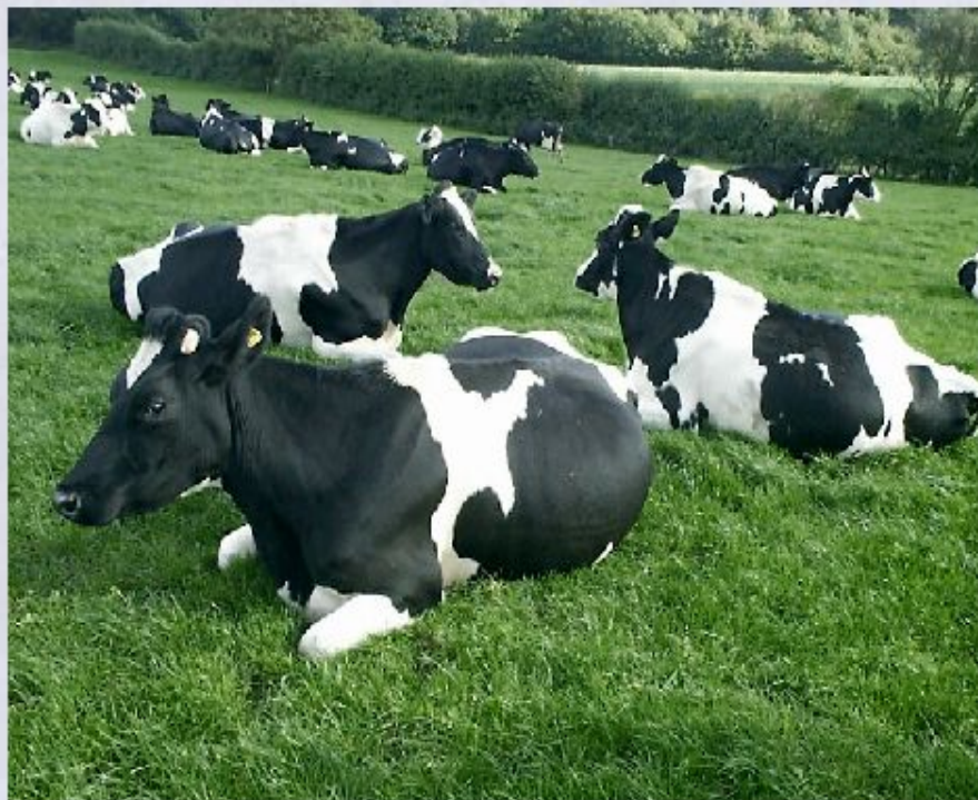
Коровы молочной породы.

Третий район занимает север и запад Центральной России, его хозяйство специализируется на выращивании зерновых ( озимая рожь, яровая пшеница), льноводстве и молочно-мясном животноводстве. Важным фактором является развитие пригородного хозяйства в окрестностях крупных городов: здесь распространено овощеводство и молочно-мясное животноводство. Насущной проблемой является необходимость значительного увеличения объёма сельскохозяйственной продукции, особенно кормов и зерна, а также усиление специализации отраслей животноводства.