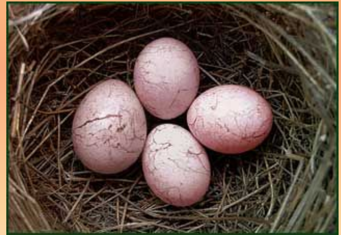
Гнездо толстоклювой камышовки с яйцом кукушки.