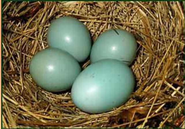
Гнездо соловья-красношейки с яйцом кукушки.