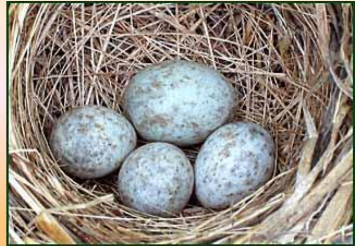
Гнездо садовой камышовки с яйцом кукушки.