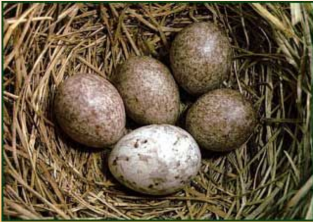
Гнездо лугового конька с яйцом