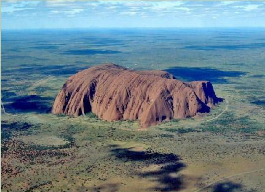
Скала Айерс-Рок (Улуру).

В центре Австралии находится Центральная равнина - самая низкая (от -12 м до 100 м) и плоская часть материка. В ее основе лежит прогиб земной коры, покрытый морскими и речными осадочными породами.