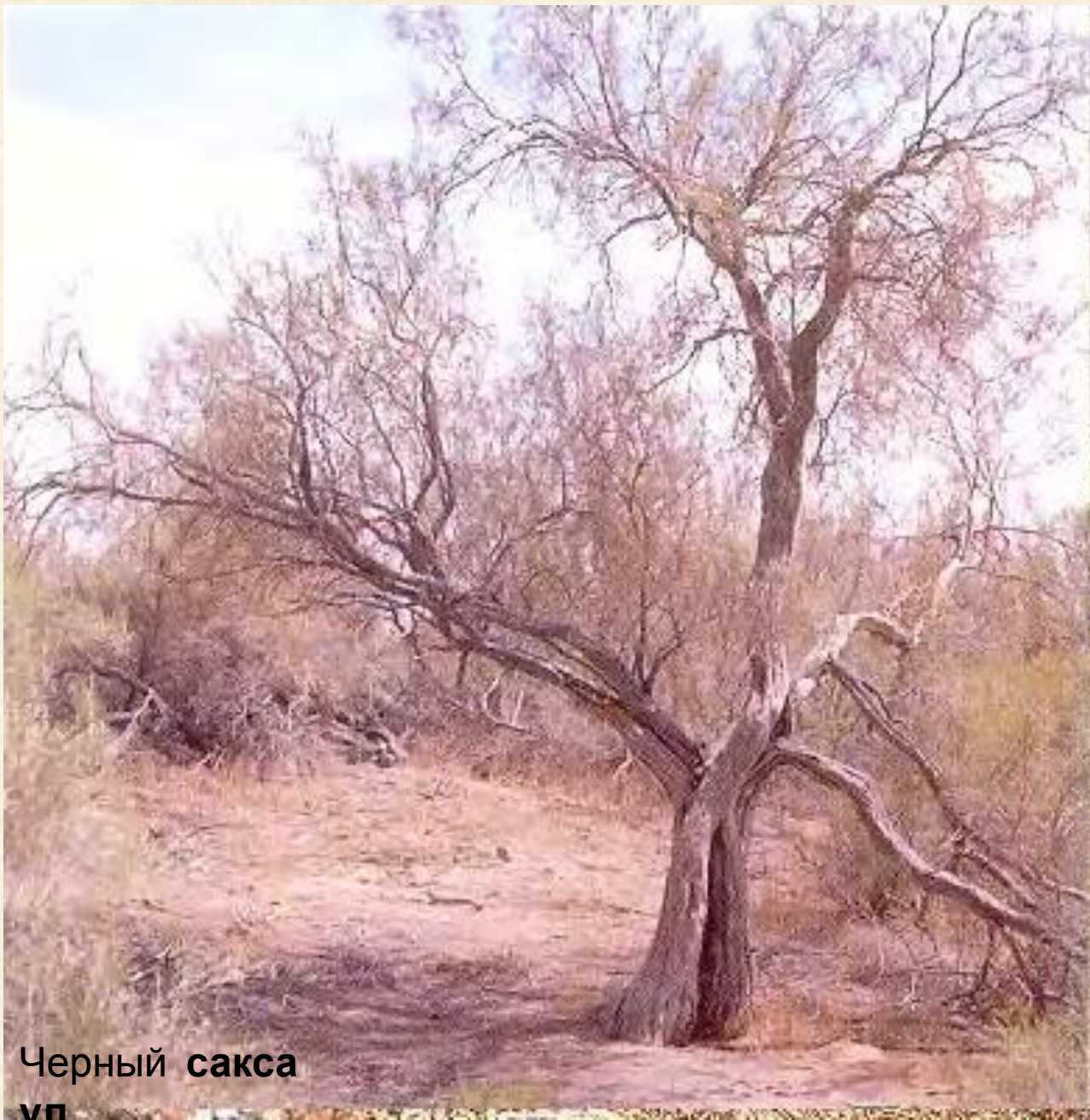
Черный сакса ул