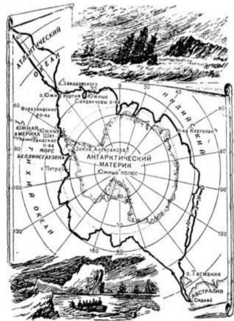
Карта маршрута экспедиции Ф. Ф. Беллинсгаузена и М. П. Лазарева вокруг Антарктиды

В 1813 году Лазарев был назначен командиром только что построенного шлюпа "Суворов", принадлежащего Российско-Американской компании, и отправлен в кругосветное плавание для изучения возможности регулярного морского сообщения между Санкт-Петербургом и Аляской. Во время этого сложного плавания, длившегося до 1816 года, Лазарев проявил свой опыт и командирские навыки, поставленная задача была выполнена, попутно были сделаны зарисовки и уточнены координаты значительных участков побережья Австралии, Южной и Северной Америк. В ходе плавания был также открыт атолл, получивший имя атолла Суворова, на котором в 1978 году был создан Национальный парк на островах Кука. Это было первое, но не последнее кругосветное плавание Лазарева. Уже в 1819 году, командуя шлюпом "Мирный" в составе кругосветной антарктической экспедиции под началом капитана второго ранга Фаддея Фаддеевича Беллинсгаузена, он отправляется в плавание к Южному полюсу. В ходе этой экспедиции был открыт новый материк - Антарктида и несколько островов. Плавание завершилось в 1821 году, за участие в экспедиции Лазарев получил воинское звание капитана второго ранга и был назначен командовать фрегатом "Крейсер", на котором в 1822-1825 годах