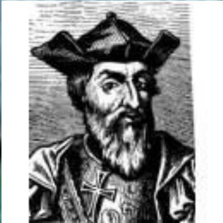
Васка до Гама