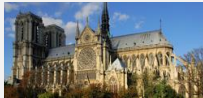
Собор Парижской богородицы