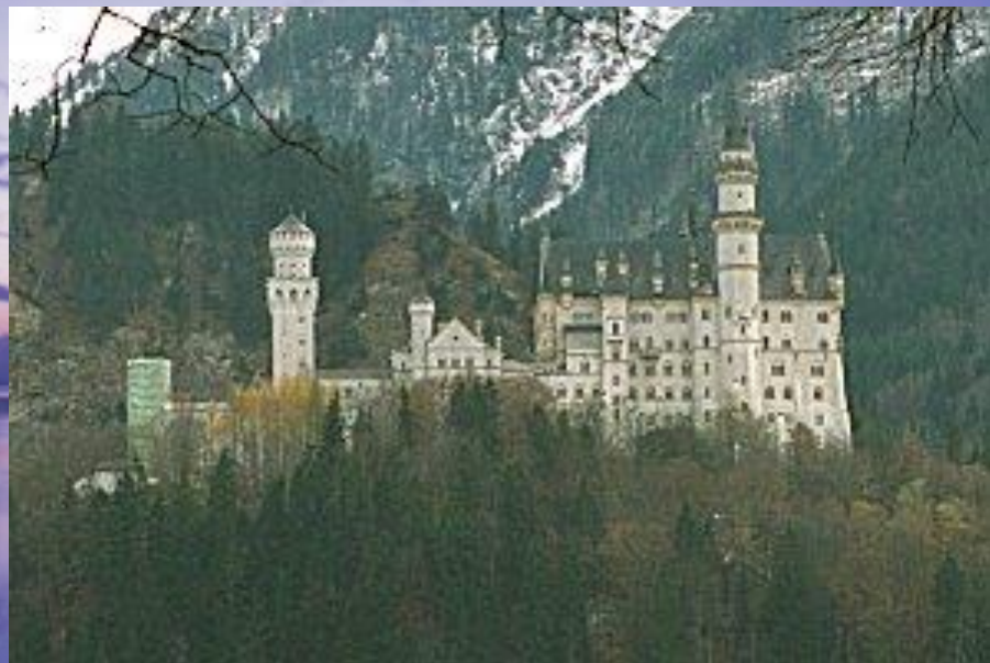
Дворец династии Виттельсбахов