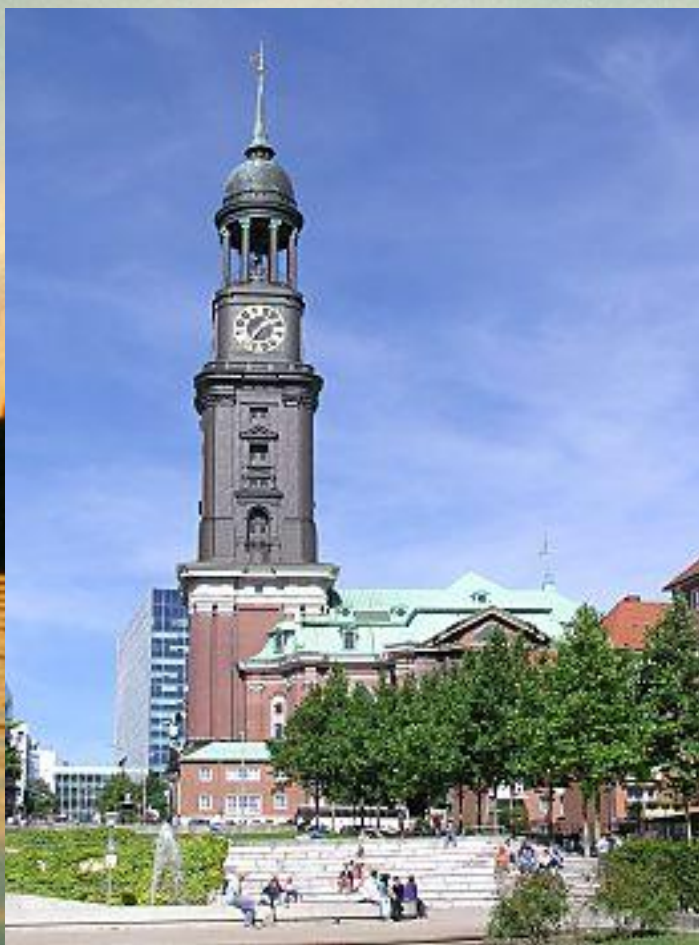
Церковь Святого Михаила