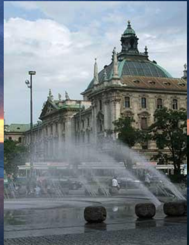
Церковь Святого Петра