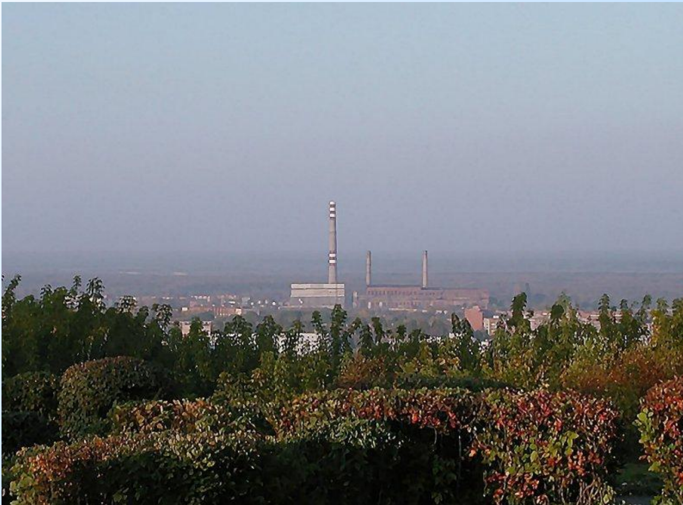
Вид со смотровой площадки