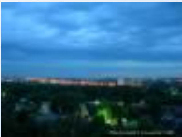
Вечер на проспекте Победы