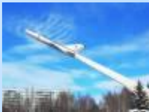
Скульптурная композиция «Самолет»