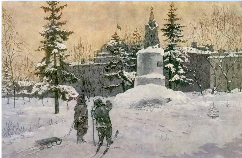
«У памятника борцам революции» работа Пензенских художников Н. М. Сидорова и А.С. Короля