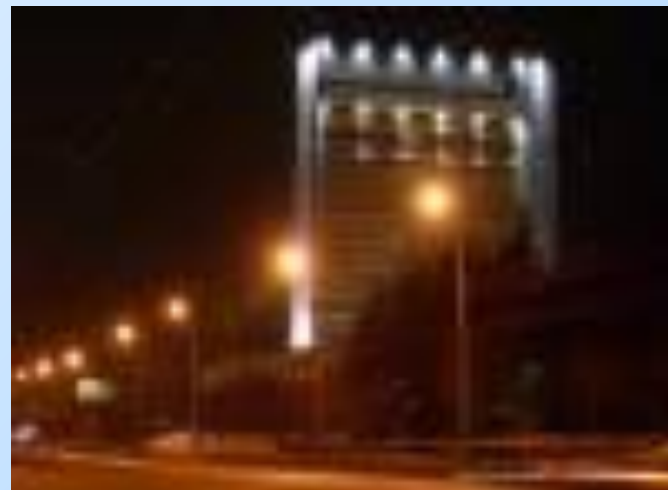
Высотка на проспекте Победы