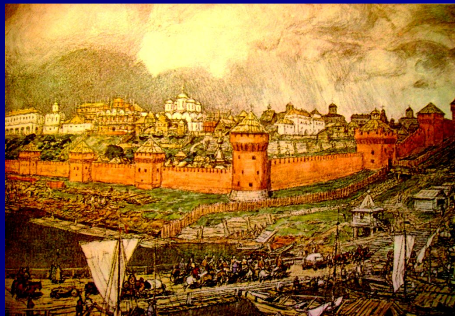
«Московский Кремль при Дмитрие Донском» «Московский Кремль при Иване III»