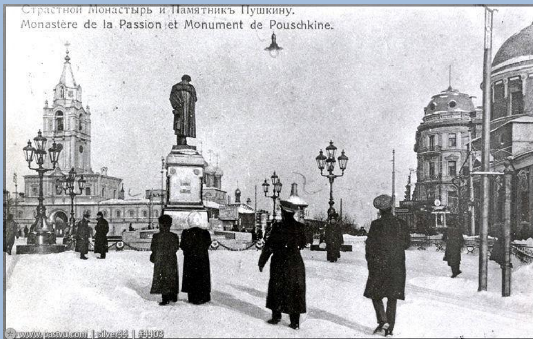
Страстная площадь (1900-1910)

«И рисует воображение дальнейшую картину: вышел печальный и мрачный поэт из клуба, пошел домой, к Никитским воротам, в дом Гончаровых, пошел по Тверской, к Страстной площади. Остановился на Тверском бульваре, на том месте, где стоит ему памятник, остановился в той же самой позе, снял шляпу с разгоряченной головы... Лето... Пусто в Москве... Все разъехались по усадьбам... Пусто в квартире... Некуда идти...»