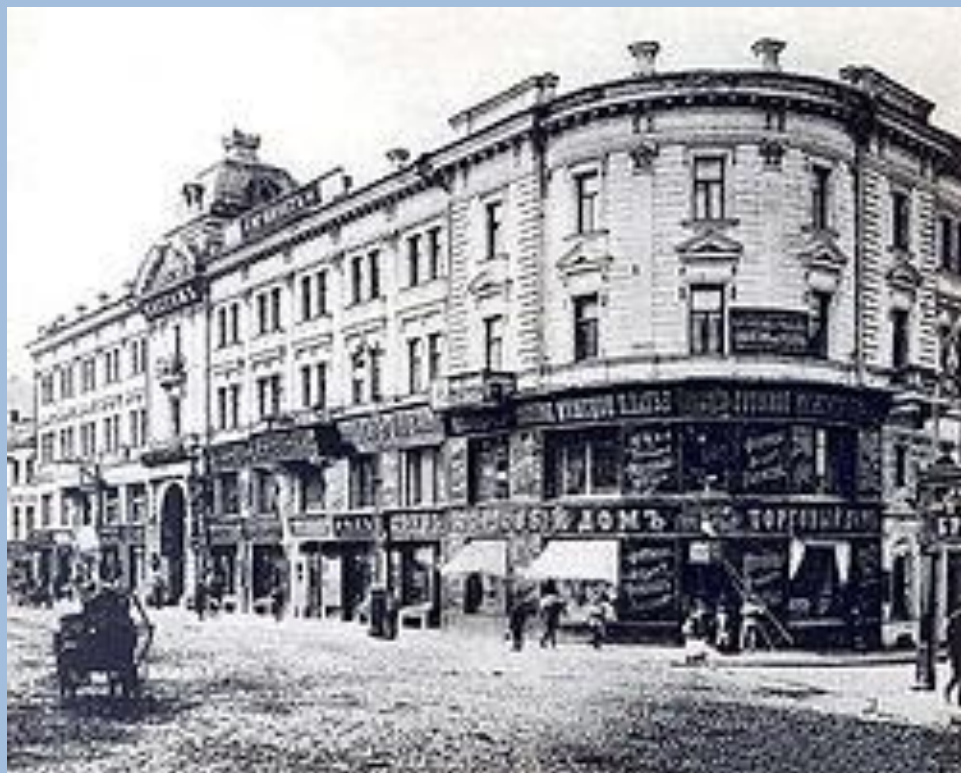
«Постниковский пассаж» (№ 5/6)