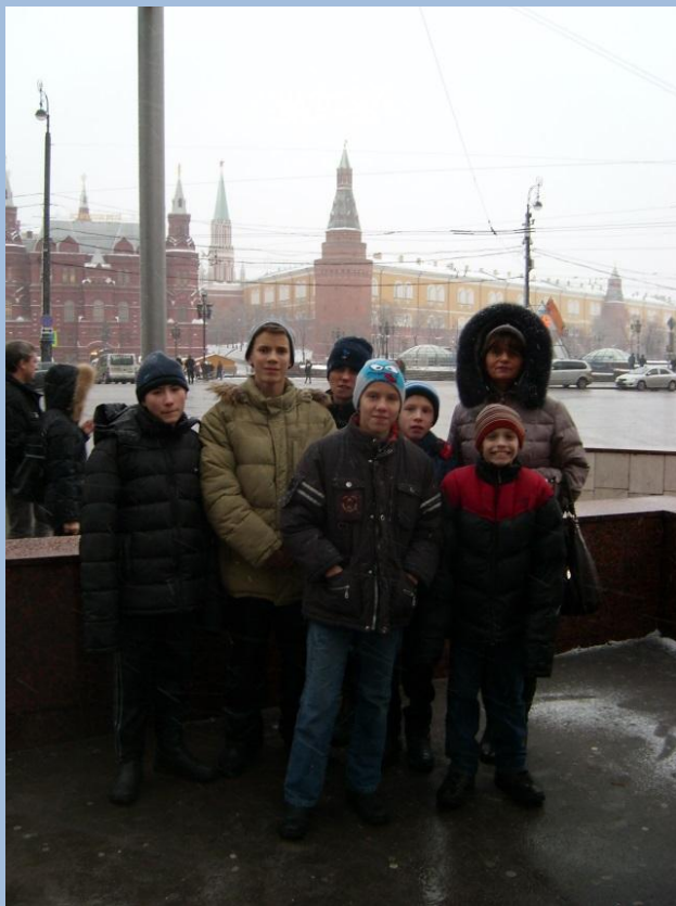
Начало путешествия по Тверской