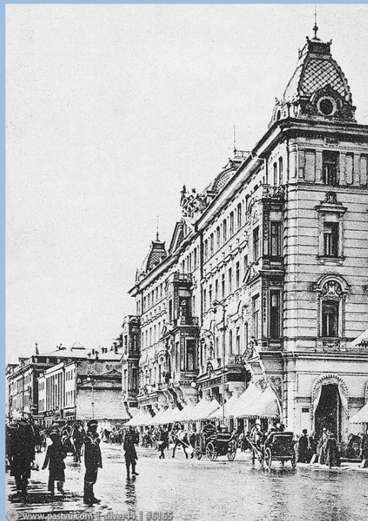
Филипповская булочная (1900-1901)