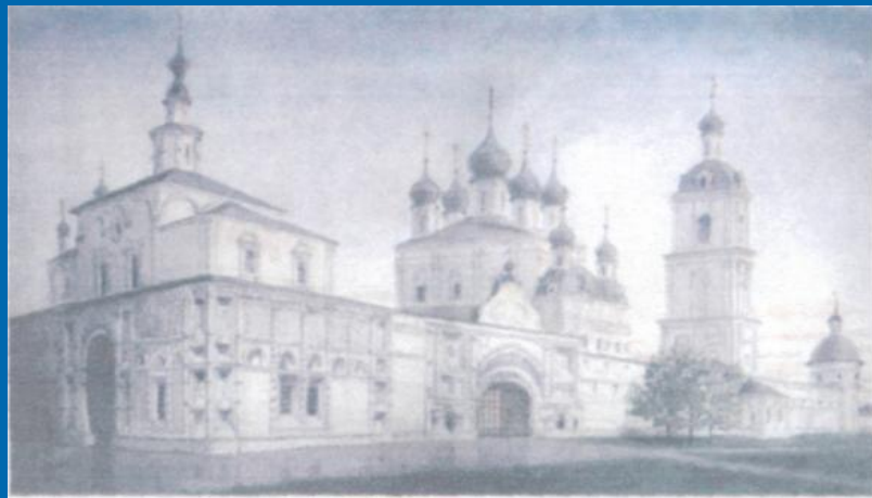
Г.Лебелев Переславль-Залесский, Горницкий монастырь

Благодаря торговому пути Переяславль быстро рос и развивался. Вскоре он стал центром самостоятельного удельного княжества. В 1238 году, как и все города владими́ро-суздальской земли, Переяславль подвергся нападению полчищ Батыя, был разграблен и сожжен.