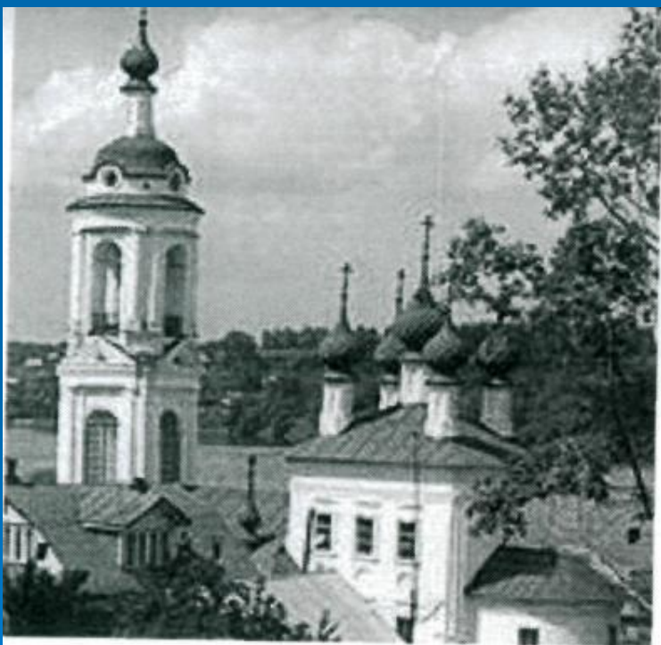
Плес. Церковь Варвары Великомученицы.