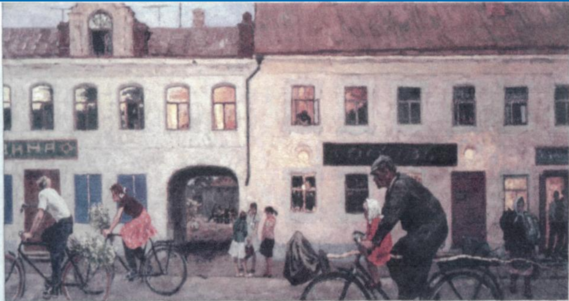
А. Тутунов Вечер в Переславль-Залесском 1960-е