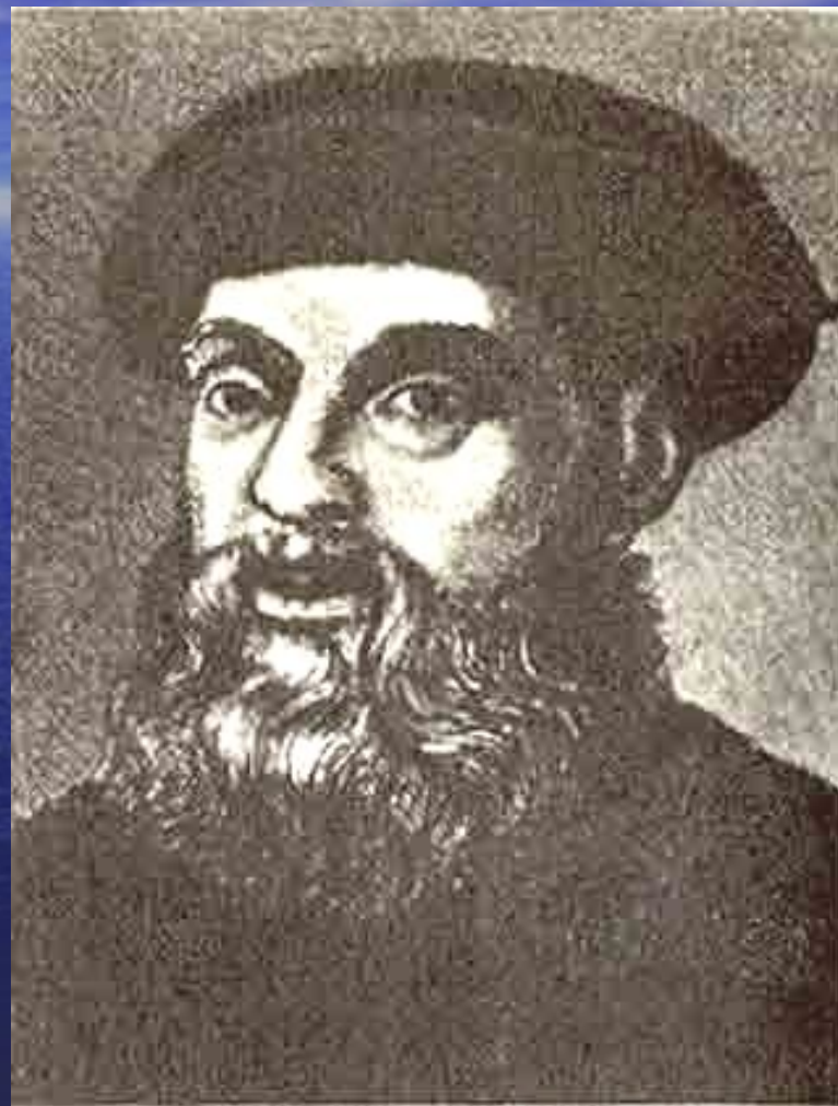
Фернан Магеллан возглавил первую кругосветную экспедицию

Открытия Колумба заставили поторопиться португальцев. В 1497 г. из Лиссабона отплыла флотилия Васко да Гамы (1469—1524) для разведки путей вокруг Африки. Обогнув мыс Доброй Надежды, он вышел в Индийский океан. Продвигаясь к северу вдоль побережья, португальцы достигли арабских торговых городов — Мозамбик и Малинди. С помощью арабского лоцмана 20 мая 1498 г. эскадра Васко да Гамы вошла в индийский порт Каликут.