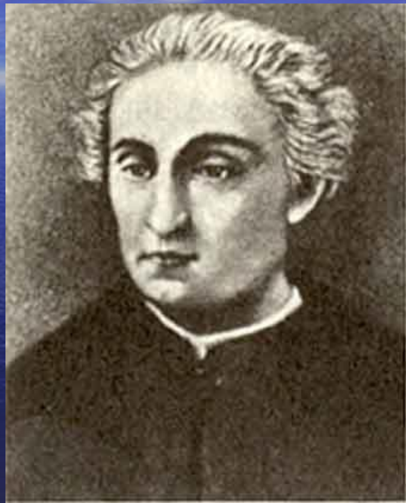
Христофор Колумб (1451-1506г.г.) С его именем связано открытие Америки

Одновременно на поиски новых торговых путей устремились и испанцы. В 1492 г. после взятия Гранады и завершения реконкисты испанские король Фердинанд и королева Изабелла приняли проект генуэзского мореплавателя Христофора Колумба (1451—1506) достичь берегов Индии, плывя на запад. У проекта Колумба было немало противников, но он получил поддержку ученых Саламанского университета, самого известного в Испании, и, что не менее существенно, среди деловых людей Севильи. 3 августа 1492 г. из Палоса — одного из лучших портов атлантического побережья Испании — отплыла флотилия Колумба, состоявшая из 3 кораблей — «Санта Мария», «Пинта» и «Нинья», экипажи которых насчитывали 120 человек. От Канарских о-вов Колумб взял курс на запад. 12 октября 1492 г., после месячного плавания в открытом океане, флот подошел к небольшому о-ву из группы Багамских о-вов, названому затем Сан-Сальвадор. Хотя вновь открытые земли были мало похожи на сказочно богатые о-ва Индии и Китая, Колумб до конца дней был убежден, что открыл о-ва у восточного побережья Азии.