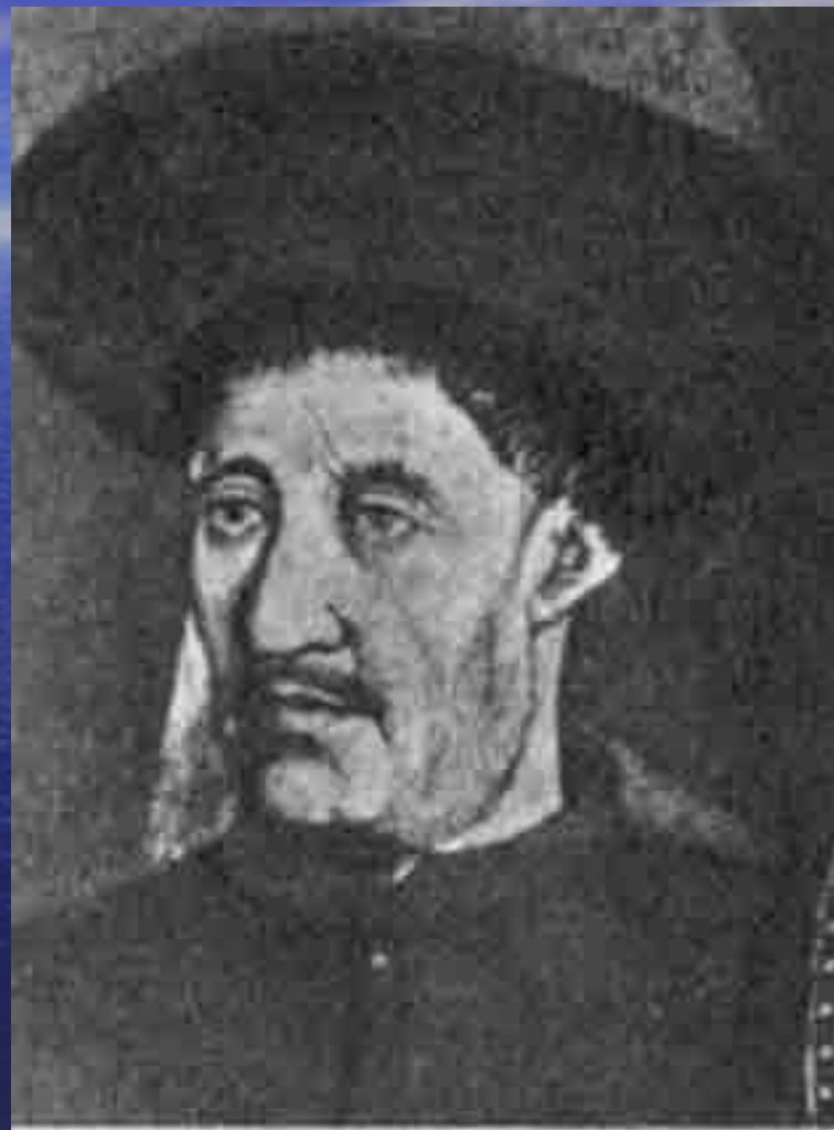
Принц Генрих (Энрике), прозванный мореплавателем, - организатор дальних плаваний португальцев

Великие географические открытия стали возможными в результате значительных успехов в развитии науки и техники в Европе. В конце 15 века широкое распространение получило учение о шарообразности Земли, расширились знания в области астрономии и географии. Были усовершенствованы навигационные приборы (компас, астролябия), появился новый тип парусного судна – каравелла.