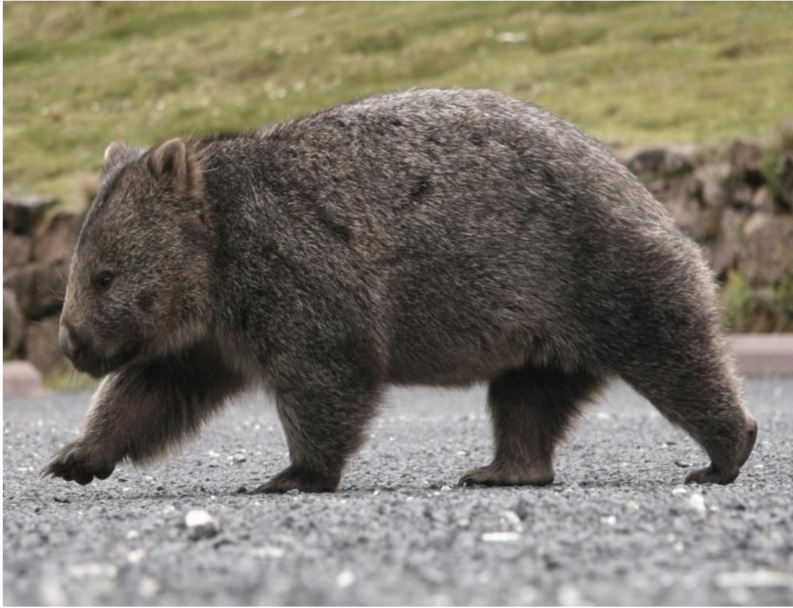
Қалталы аю вомбат