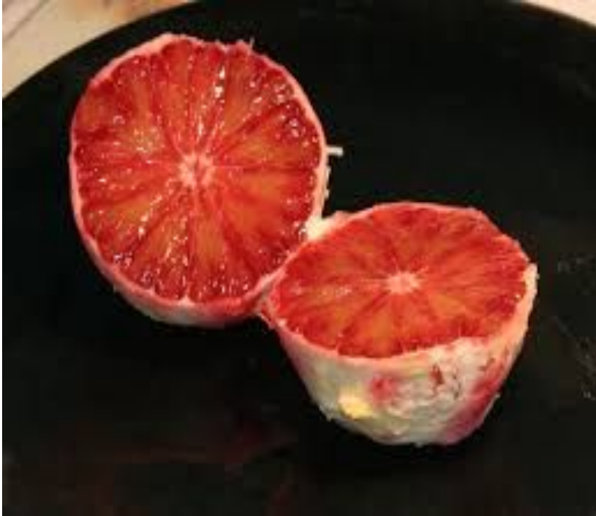
Африкалық шие апельсины