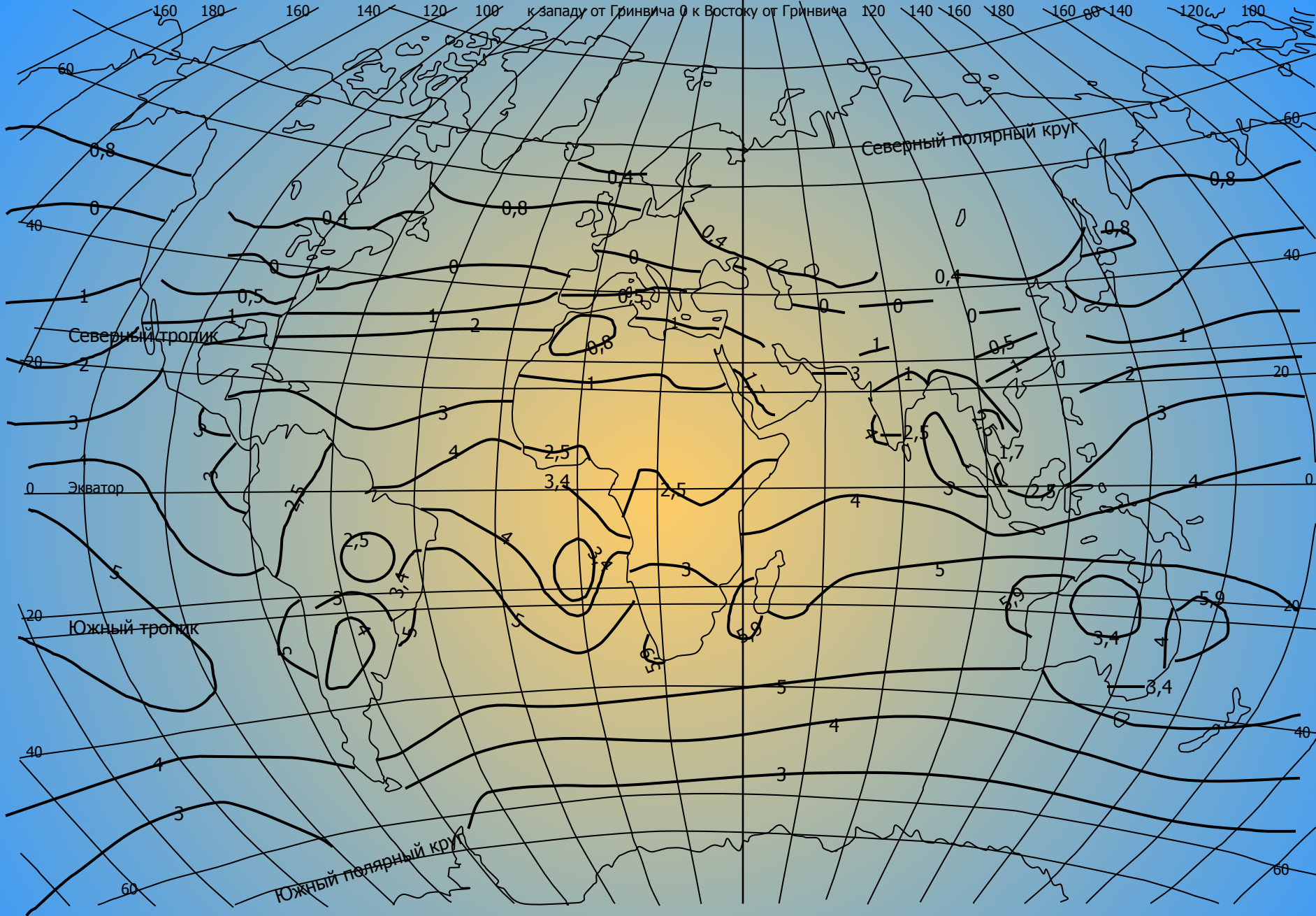
Рис. 3 Радиационный баланс земной поверхности за декабрь (Любушкина, 2004)