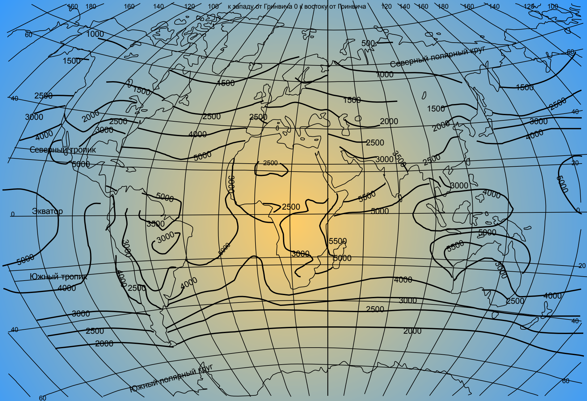
Рис. 2 Радиационный баланс земной поверхности за год