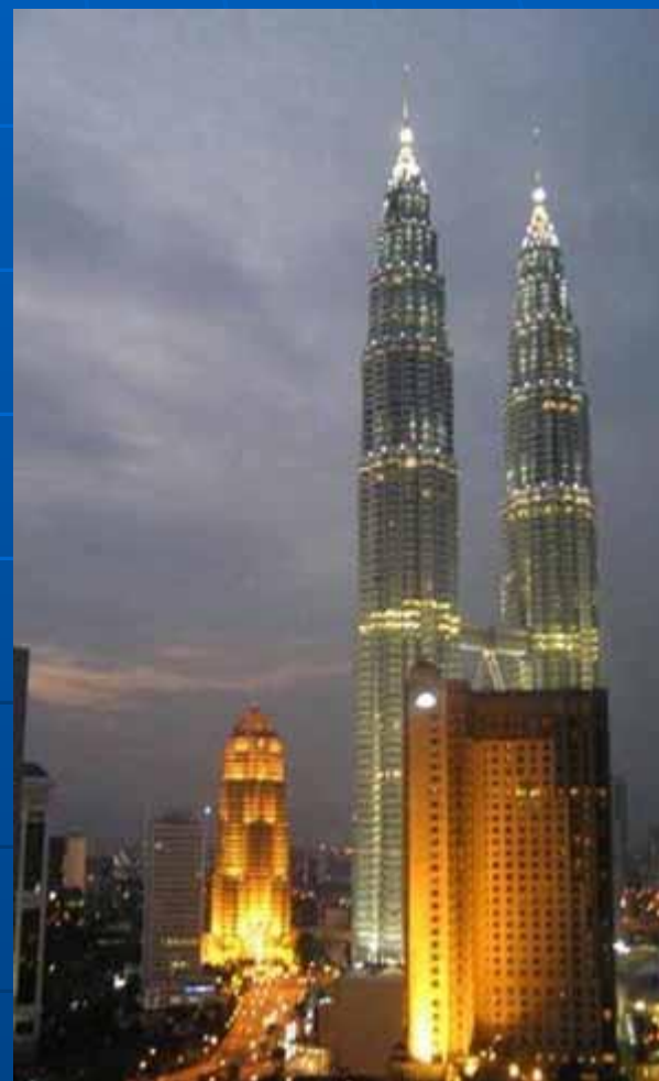
Башни Коало и Лумпур ( Малайсия )