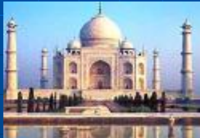
Агра – древняя столица Великих Моголов