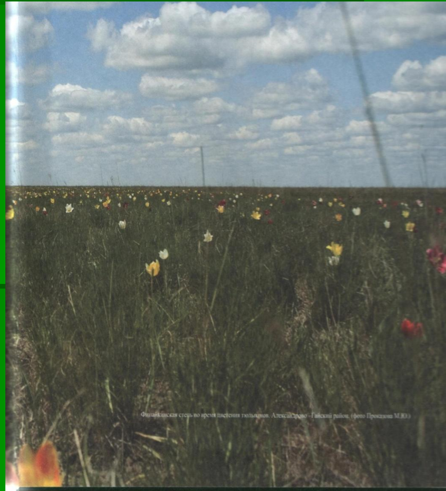
Финляндская степь во время цветения тюльпанов. АлексийСредно - Гайский район.