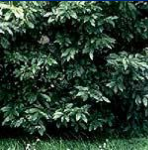
Лавр благородный (Laurus Nobilis) Местное название-Алей Дафна