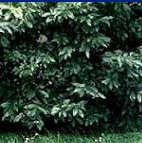
Лавр благородный (Laurus Nobilis) Местное название-Алей Дафна