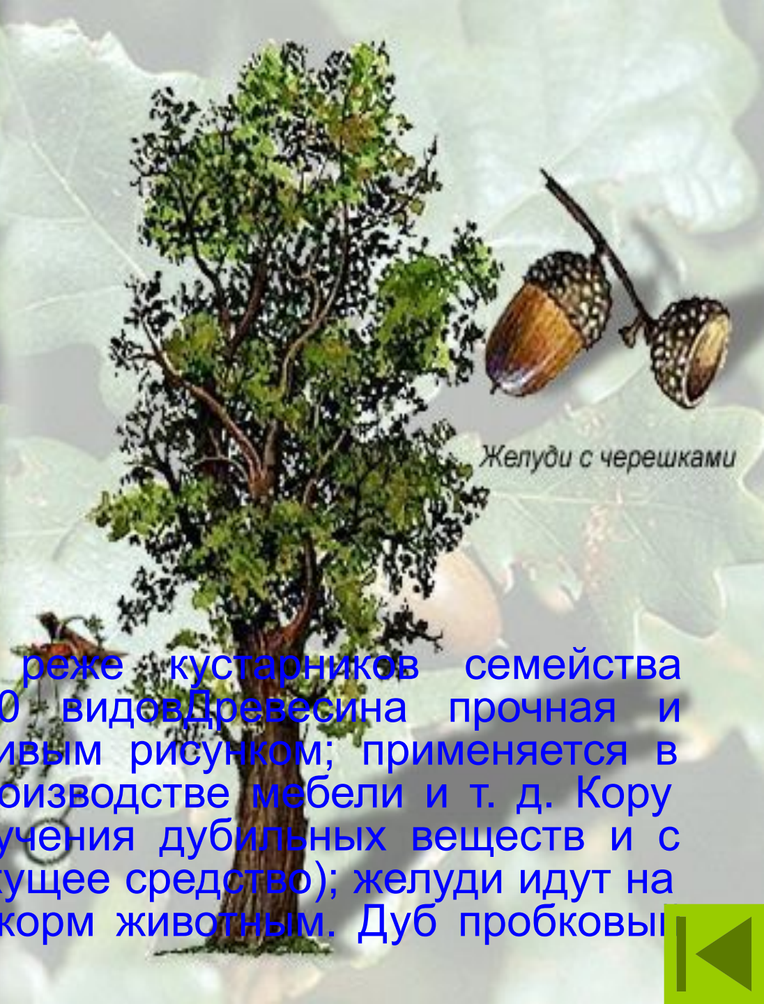
Желуди с черешками

ДУБ; род деревьев, реже кустарников семейства буковых. Около 450 видов. Древесина прочная и долговечная, с красивым рисунком; применяется в кораблестроении, производстве мебели и т. д. Кору используют для получения дубильных веществ и с лечебной целью (вяжущее средство); желуди идут на суррогат кофе и на корм животным. Дуб пробковый дает пробку.