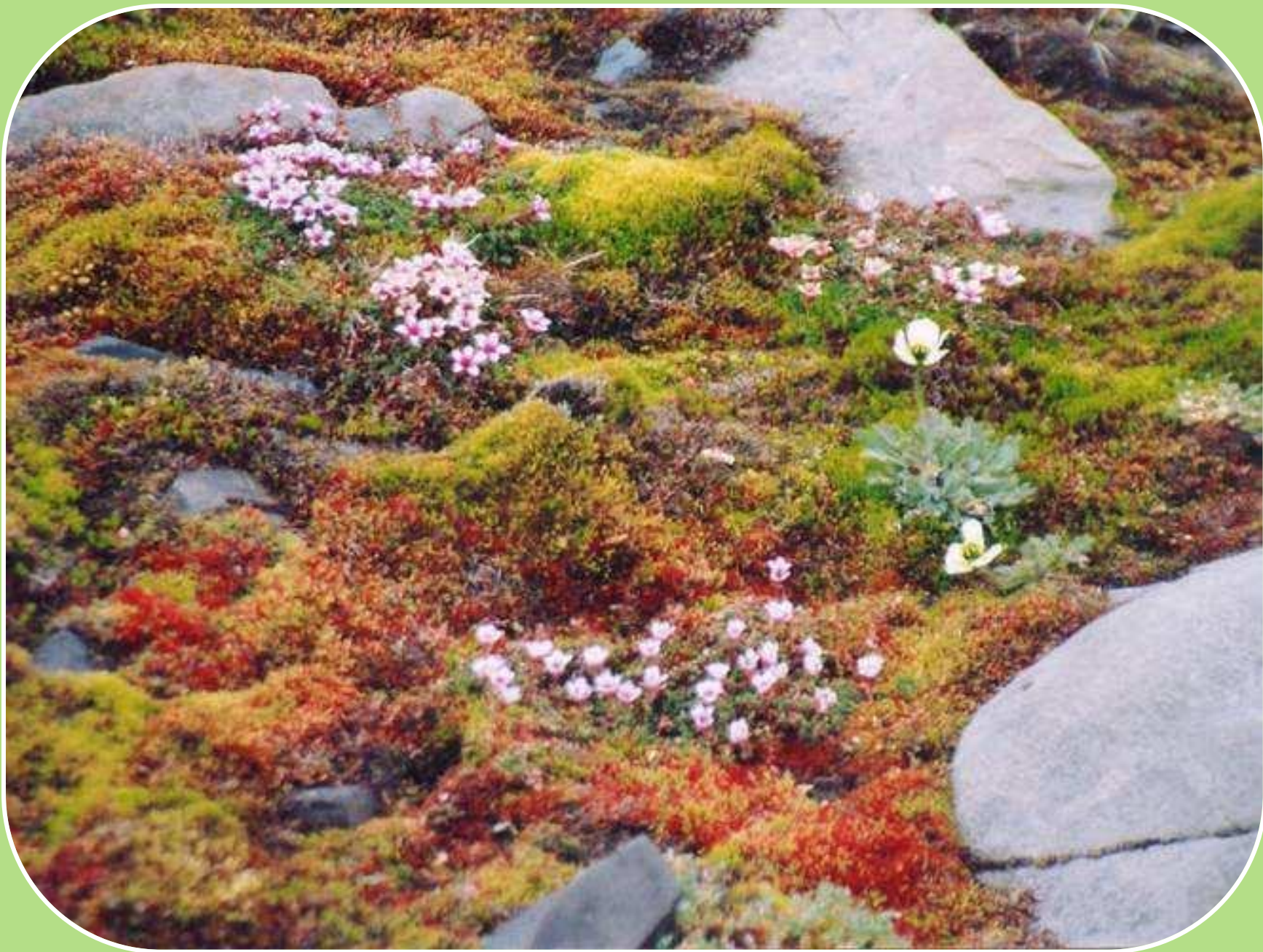
Тундра весной очень красива