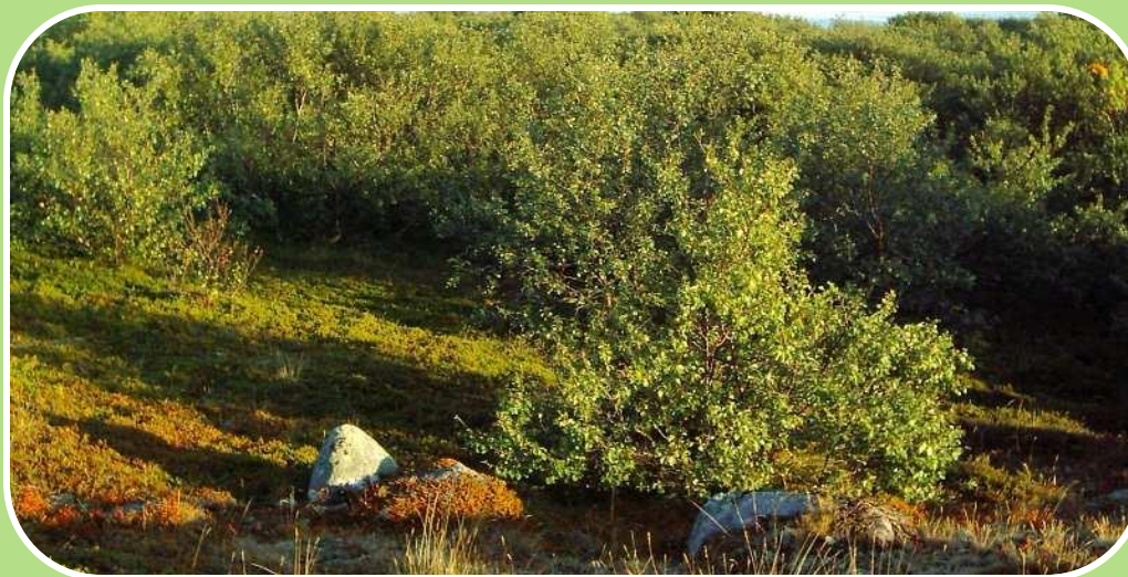
Так выглядит лес в тундре