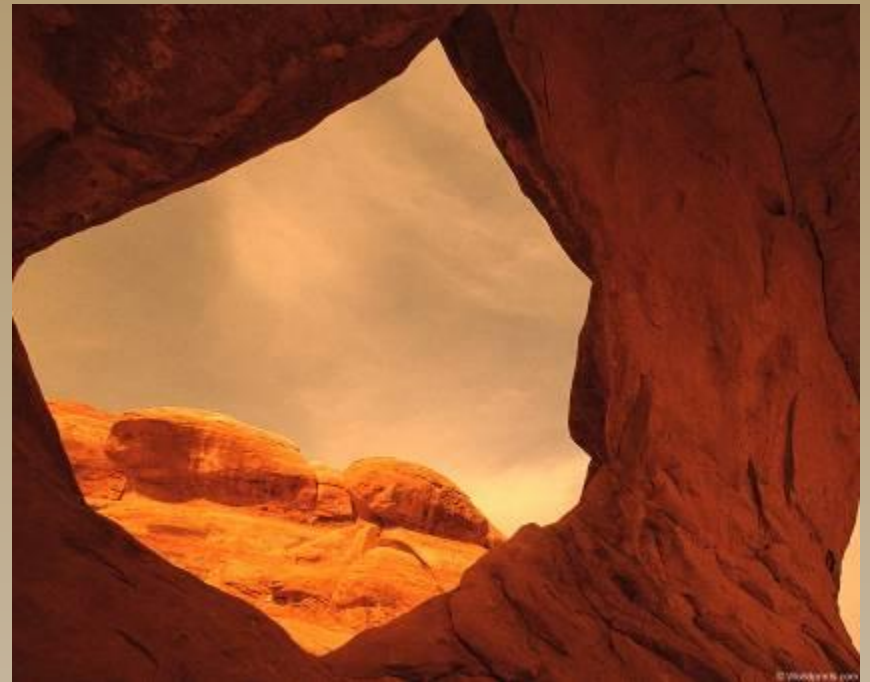
Останцы в пустыне