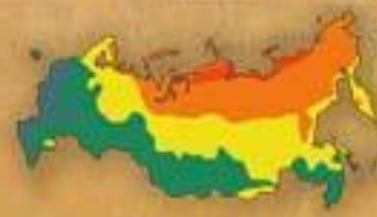
СТЕПЕНЬ БЛАГОПРИ- ЯТНОСТИ ПРИРОДНЫХ УСЛОВИЙ ЖИЗНИ НАСЕЛЕНИЯ