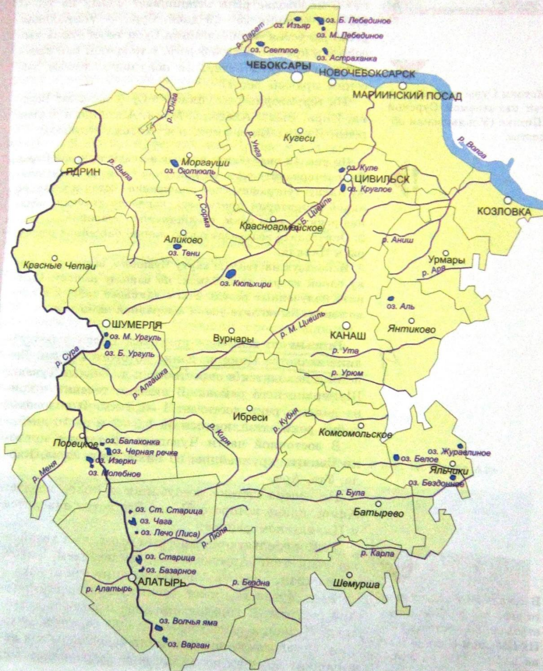
Рис. 12. Реки и озера Чувашской Республики