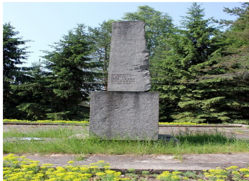
Мемориал парк «Свирская победа»