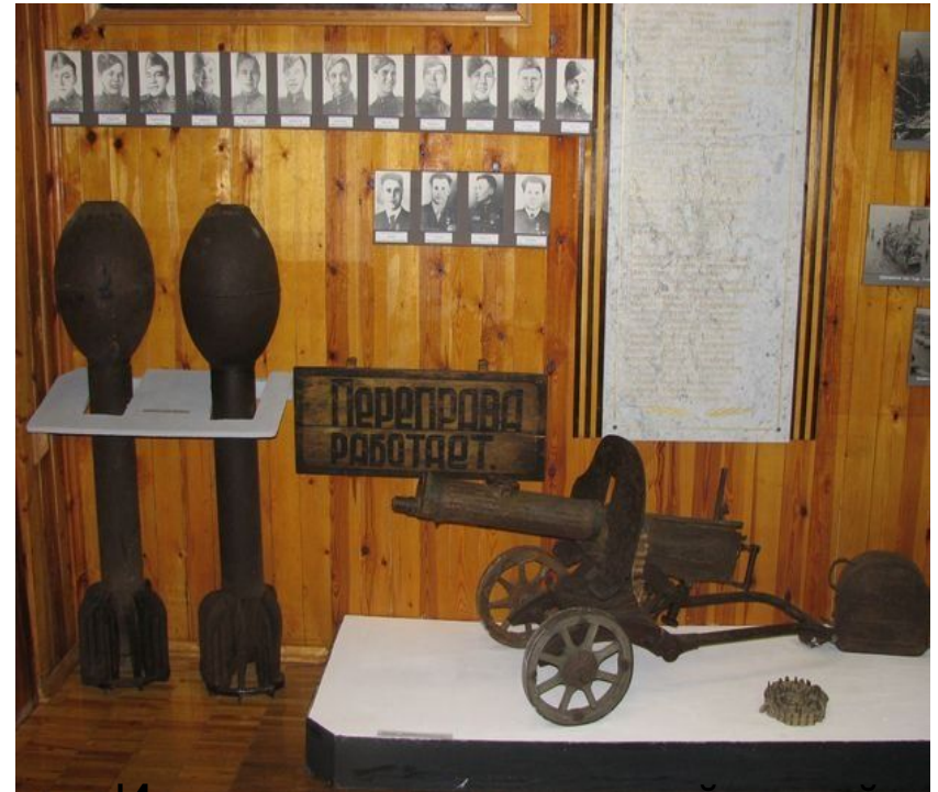
Историко-краеведческий музей г. Лодейное поле