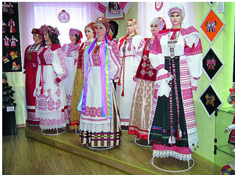
Народная студия декоративно-прикладного искусства «Домовушка»

Лодейнопольский район- край удивительной северной природы, расположенный на северо-востоке Ленинградской области на границе с Карелией. Здесь можно соединить для себя общение с природой и ознакомление с богатыми культурными и историческими традициями этого края.