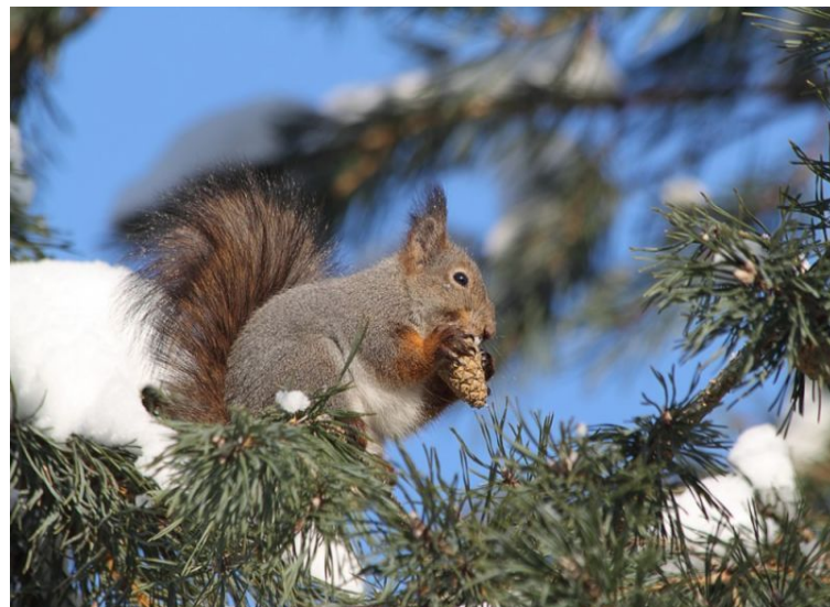
Нижне-Свирский орнитологический заповедник