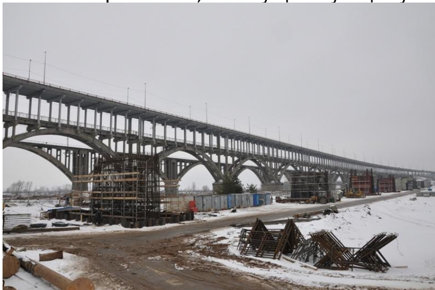
Общий вид левобережной эстакады