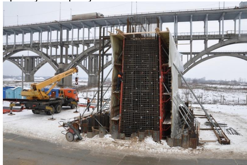
Устройство каркаса массивной части опоры N10 левобережной эстакады