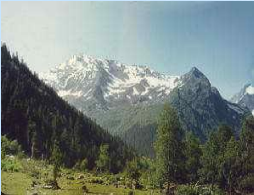
Фото. Горы Кавказ

«Кавказ подо мною. Один в вышине Стою над снегами у края стремнины: Орел, с отдаленной поднявшись вершины, Парит неподвижно со мной наравне.