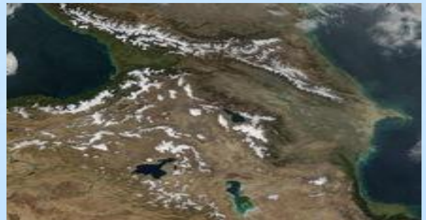
Снимок из космоса. Кавказ.