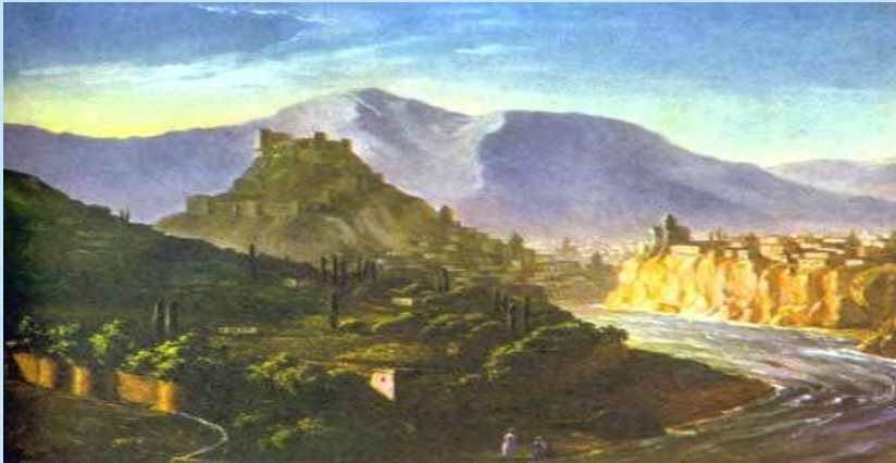
М.Ю. Лермонтов. Северный Кавказ.