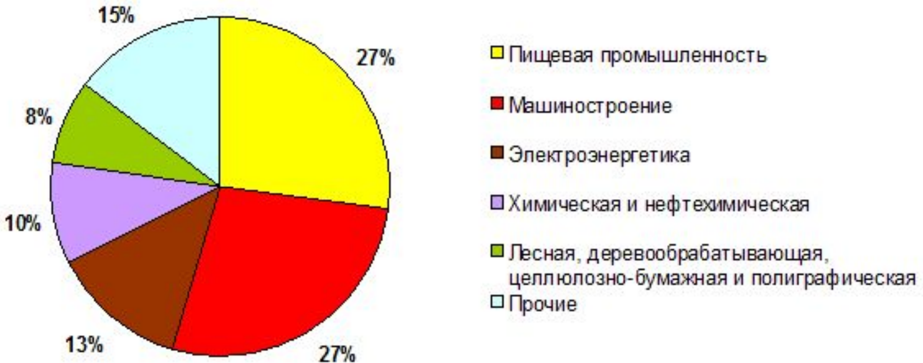
Отраслевая структура промышленности Пензенской области, 2005 г.

Наибольший удельный вес продукции от ее общего объема приходится на предприятия машиностроения и металлообработки (29,5%), пищевой промышленности (24,9%).