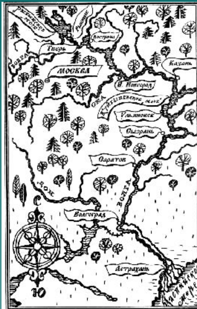
Схематическая карта Волги