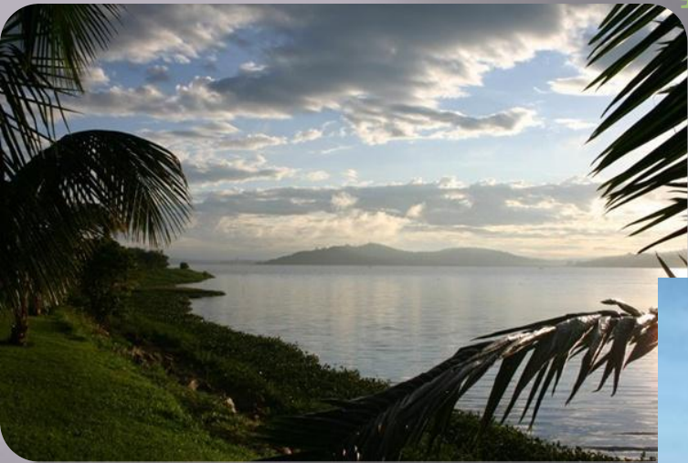
Фото озера Виктория