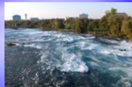
Ниагара Н иагара