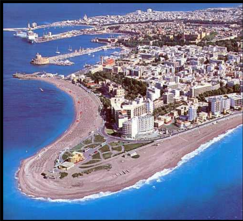
Курорты на острове Радос