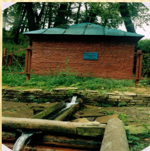
Калиновский ключ (п.Красногвардейский)