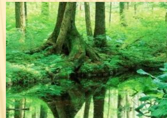
Шайтанская канава (п.Красногвардейский)