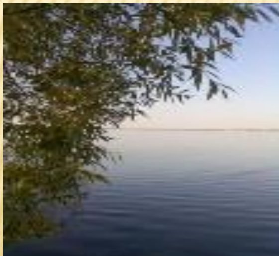
ОЗЕРО ШАРТАШ (ЕКАТЕРИНБУРГ)