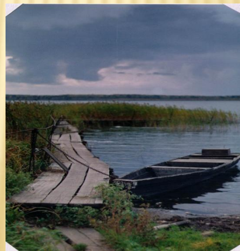
Озеро Белое (с.Покровское)