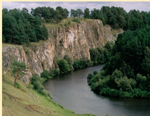
Мантуров Камень (с.Мироново)