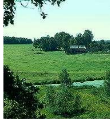
Русская равнина, Река Пра в Мещере.