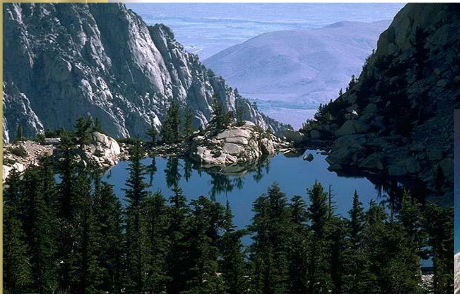
Озеро в горах.