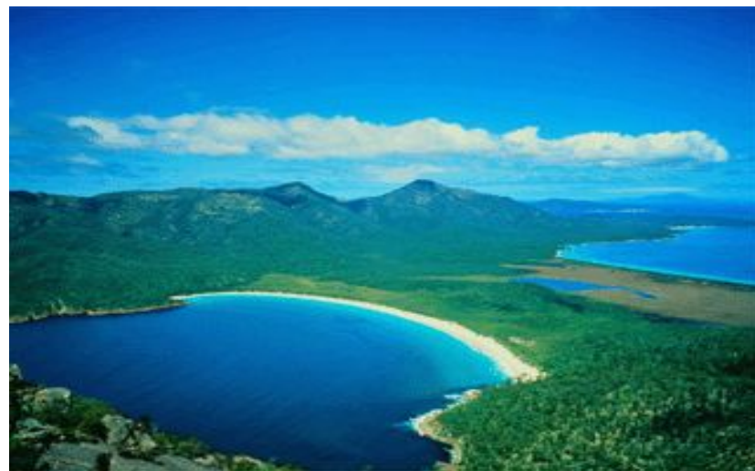
Восточные склоны покрыты тропической растительностью.