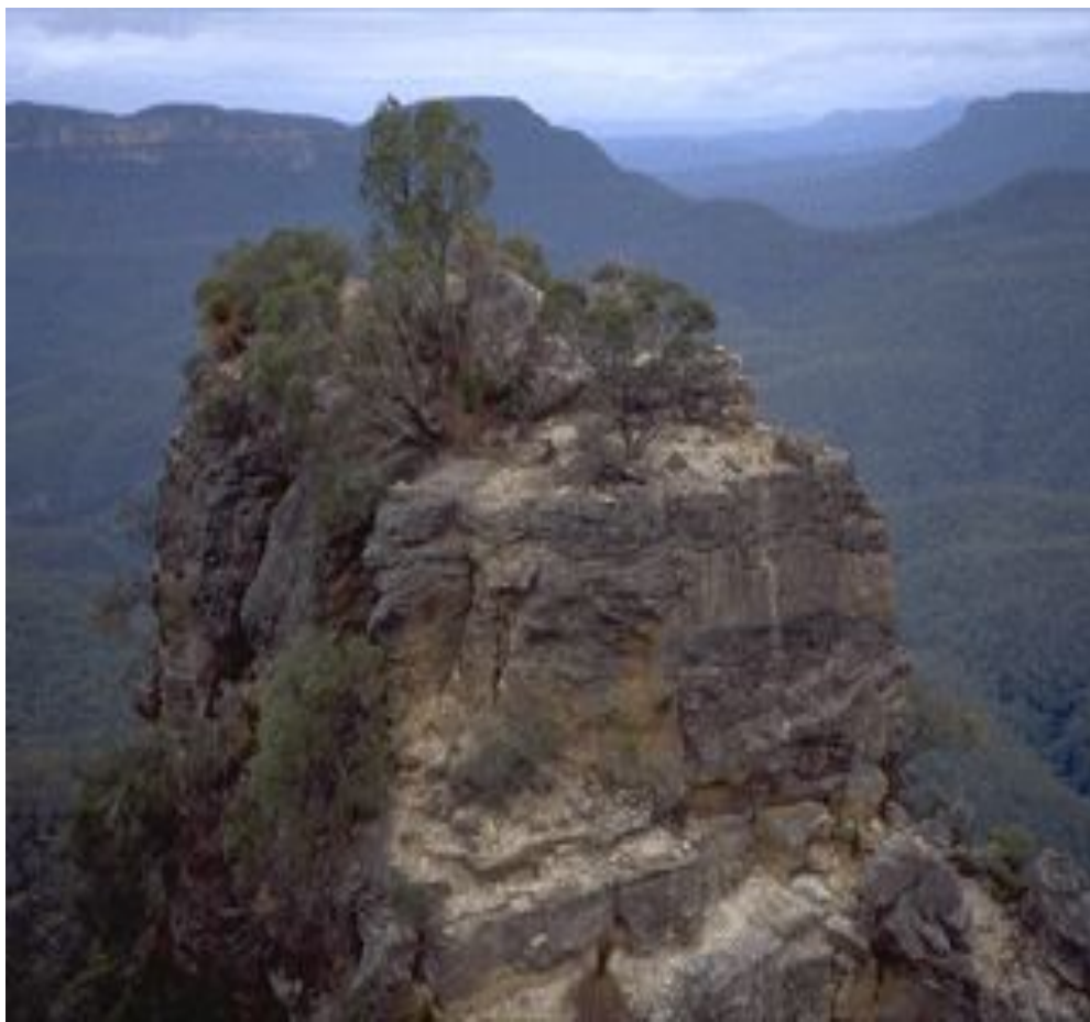
Южная часть Большого Водораздельного хребта выше северной его оконечности.