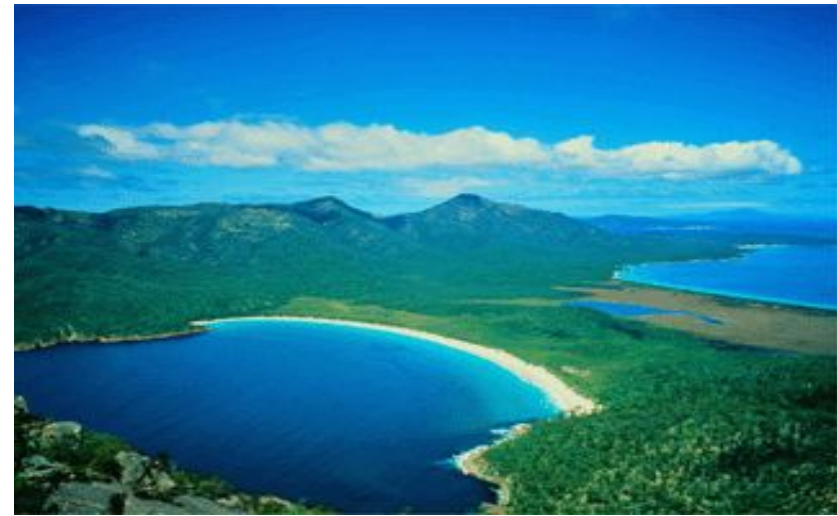
Восточные склоны покрыты тропической растительностью.