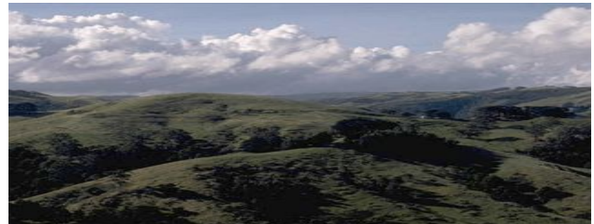
Средние высоты хребта меньше 1000 м над уровнем моря.