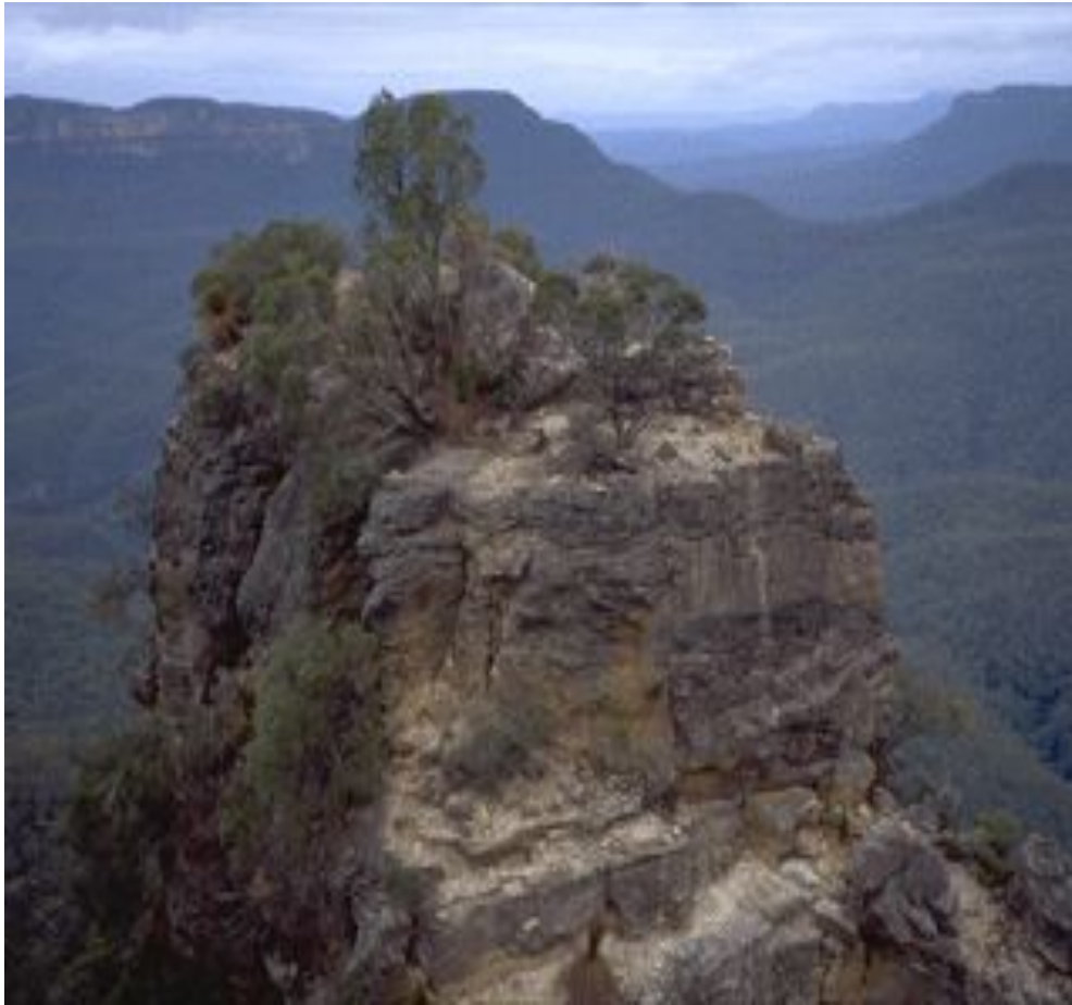
Южная часть Большого Водораздельного хребта выше северной его оконечности.